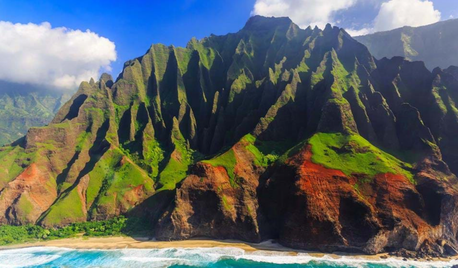
Kauai på Hawaii