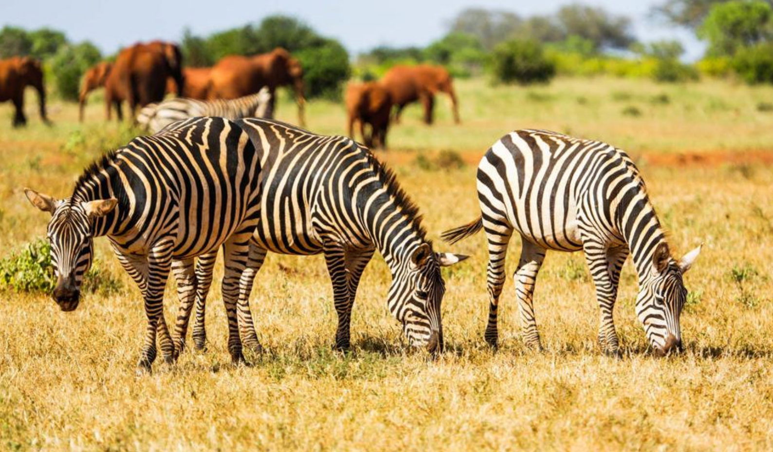
Zebraer i Tsavo West