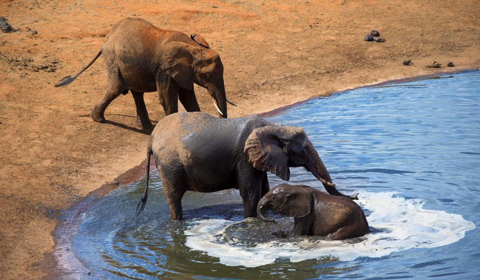
Elefanter i Tsavo National Park

Hotellet har også et vandsportscenter, der tilbyder fiskerture og glasbådsture eller mulighed for at komme ud at snorkle eller ro i kajak. Blot fem minutters gang fra hotellet ligger der også en golfbane.