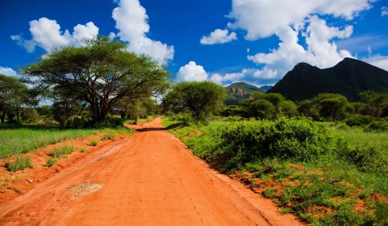
Tsavo National Park