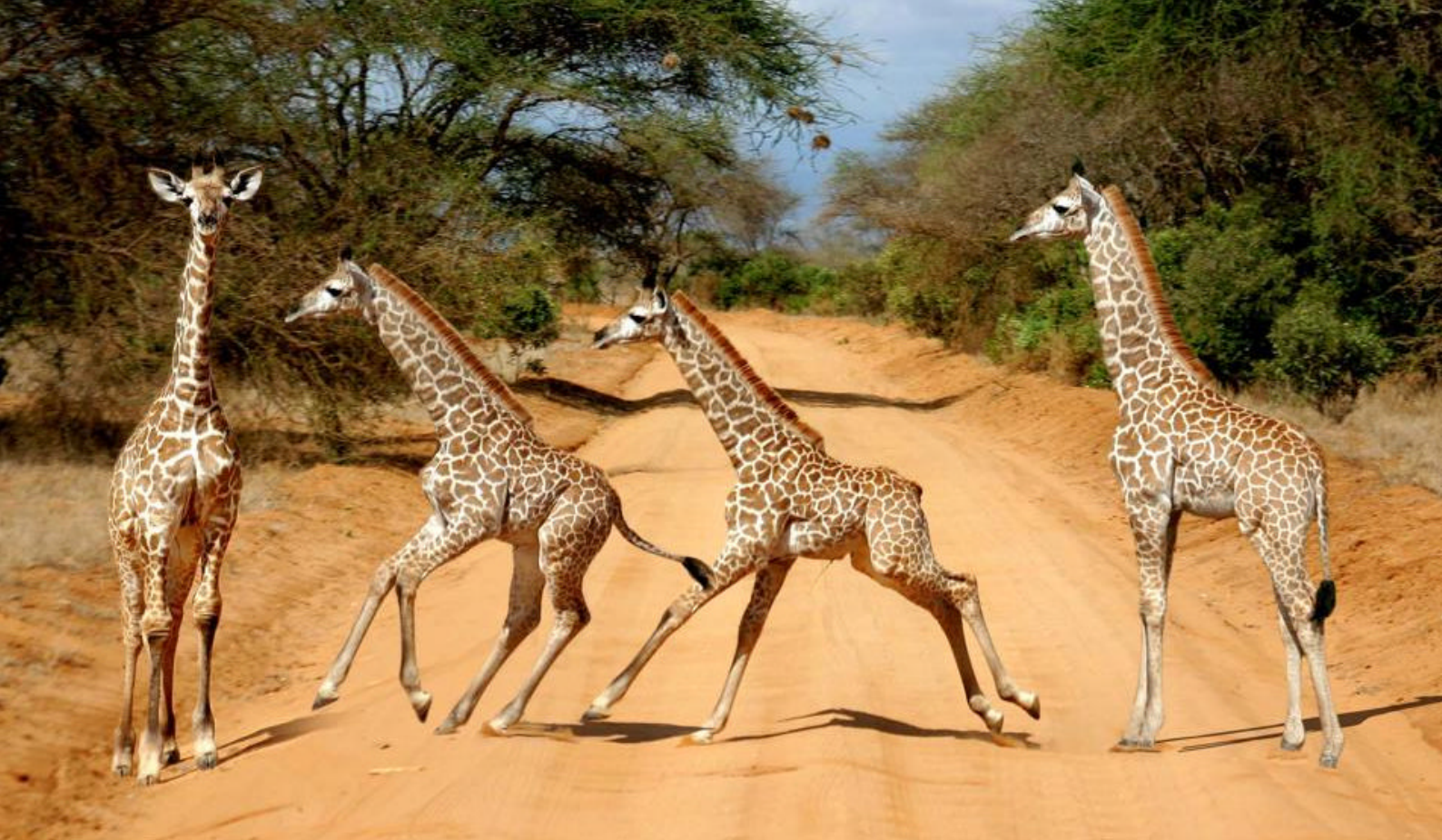
Unge giraffer i Tsavo National Park