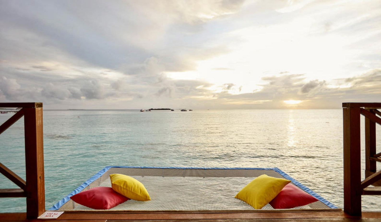
Udsigt fra Aqua Villa

katamaran eller en traditionel dhoni-båd. Udvid eventyret med en picnic, som I kan nyde fra et 'hemmeligt' sted på en ø og se, hvor mange delfiner, I kan få øje på under frokosten.