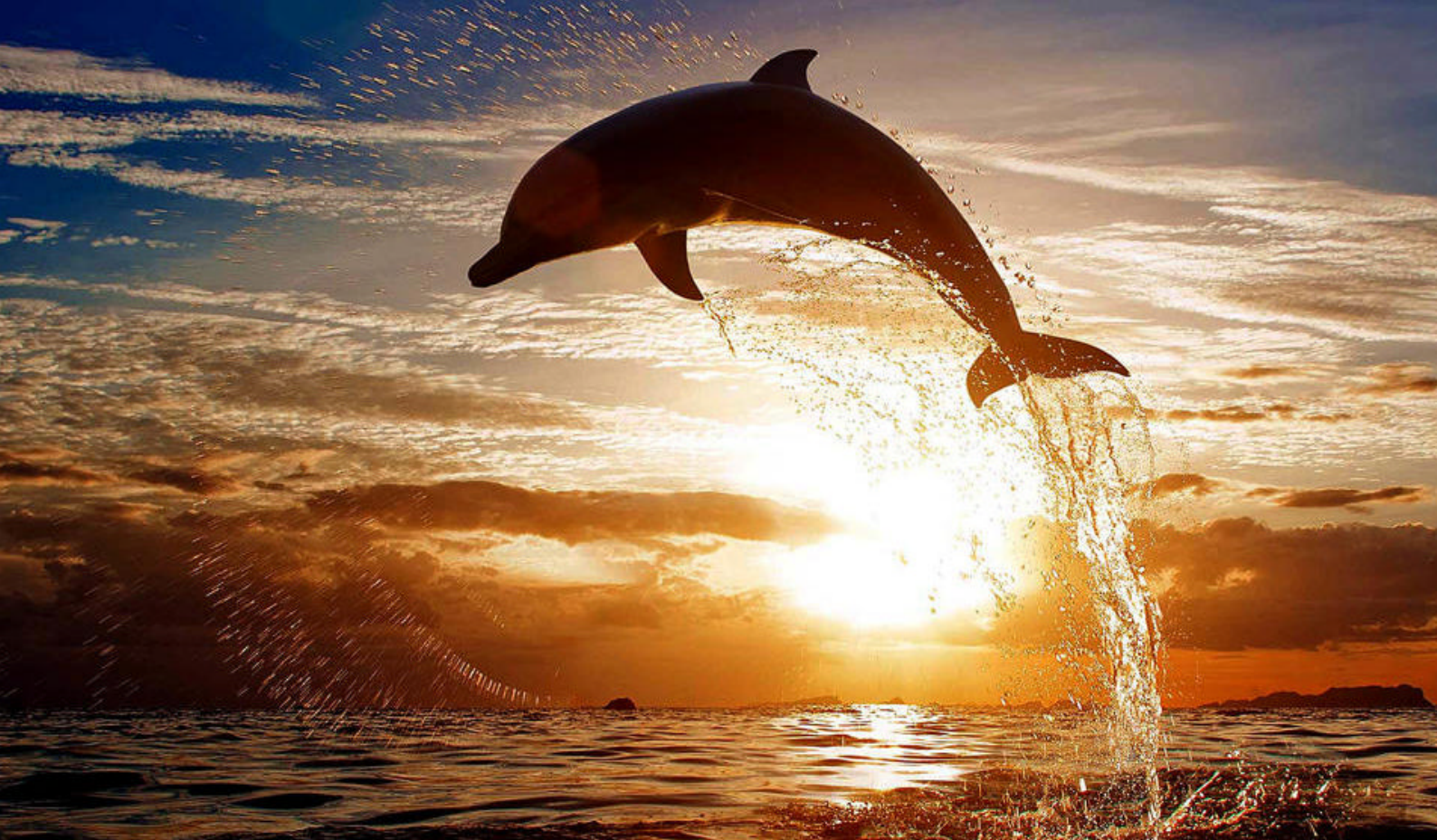
Sunset Dolphin Cruise

djævlerekker, skildpadder, de enorme, op til 2 m. lange, napoleonsfisk og de ufarlige revhajer. Resortet har et fuldt udstyret dykkercenter, der drives af certificerede dykkere. Nybegyndere kan lære at dykke, mens de mere erfarne kan tage på skræddersyede dykkerture til atollens bedste steder.