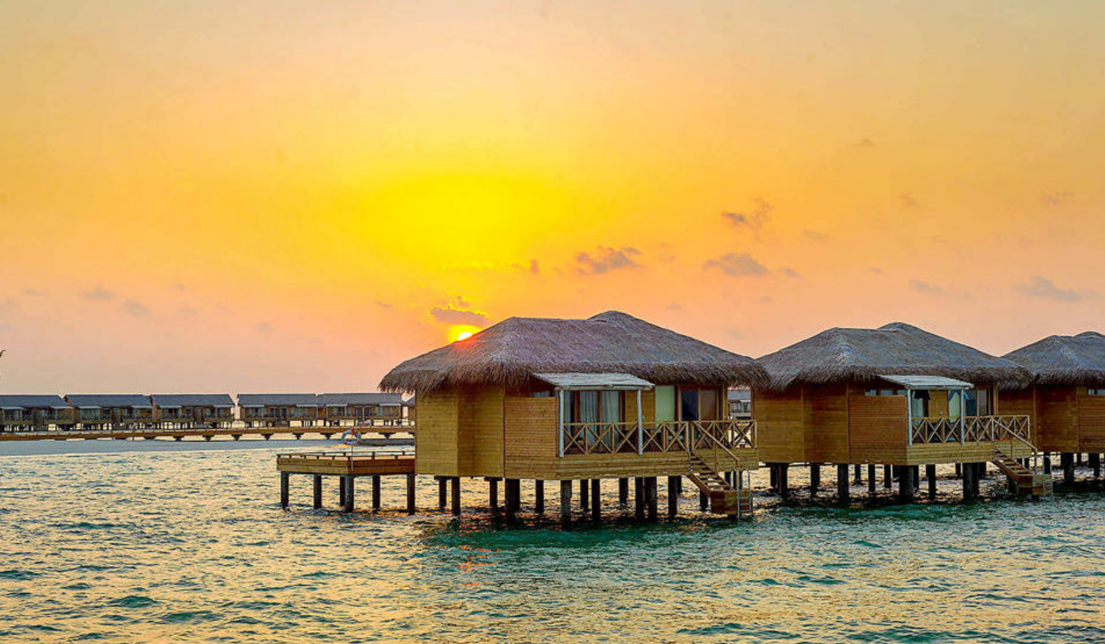
Beach Suites med pool

You & Me by Cocoon ligger på en privat, rustik og romantisk ø i et smukt, uberørt hjørne af Maldiverne. Dette er en verden væk fra hverdagens stres, og resortet er et perfekt sted for afslapning og til at opnå rigtig kvalitetstid som par. Resortet er et 5-stjernet feriested i Raa atollen i det nordlige Maldiverne bygget i 2019. You & Me by Cocoon er kun for voksne og således særdeles velegnet til en bryllupsrejse eller en rejse for par og venner. Den rolige atmosfære gør stedet til et afslappende refugium langt væk fra snart alt.