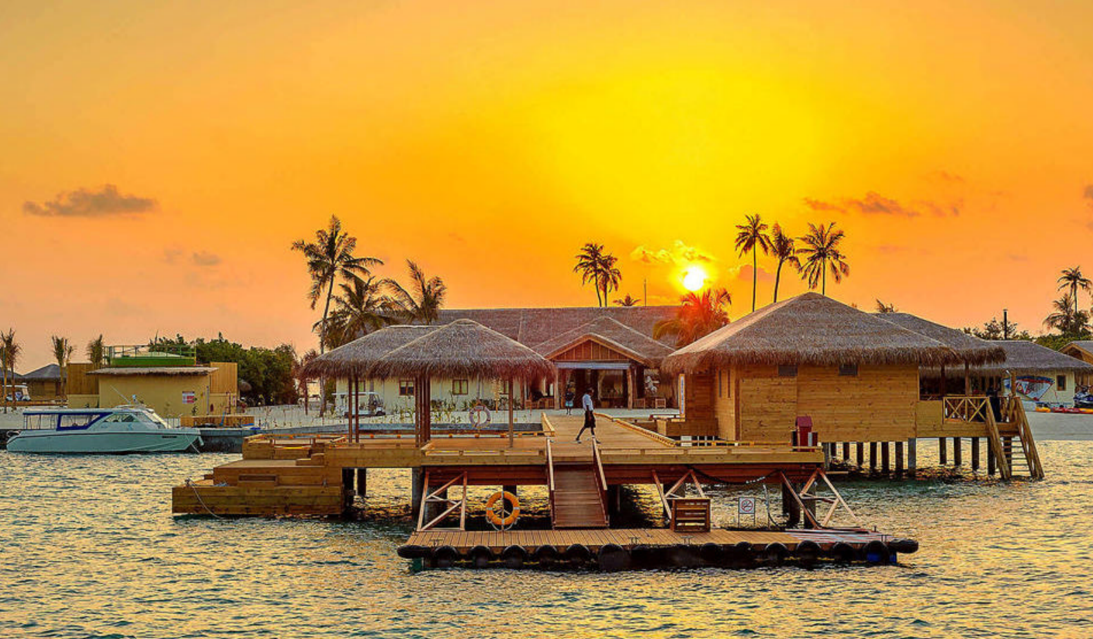
Ankomst til You & Me by Cocoon