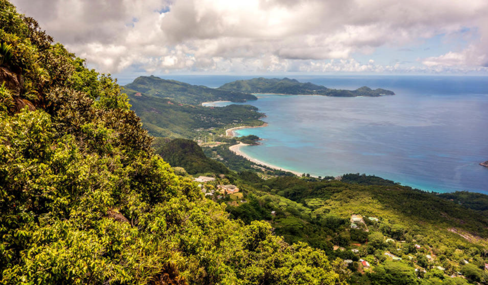
Nationalparken Morne Seychellois, Mahe

samt en dejlig pool. Selve strandvillaen er udstyret med køkken, badeværelse, komfortabel seng, A/C m.m.