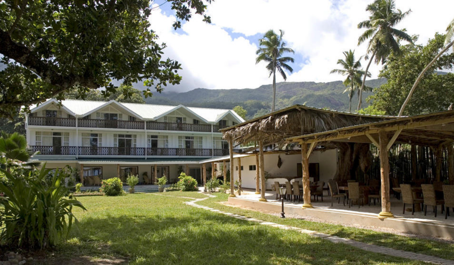
Hotel Augerine på Mahe

højeste bjerge. Den centrale del af nationalparken er dækket af tæt frodig, regnskov, som er fremragende at udforske.