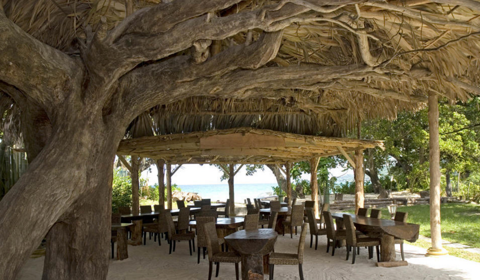
Hotellrestauranten på Augerine