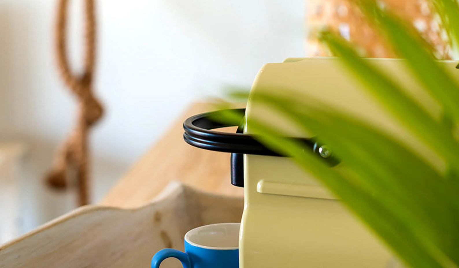
Nespressomaskine på hotelværelset i Carana, Mahe

at sikre den videre bevarelse af en af verdens største skildpaddearter. Øen består desuden af mangroveskove såvel som andre tropiske skove, endemisk flora og fauna, og der er gode vandrestier.