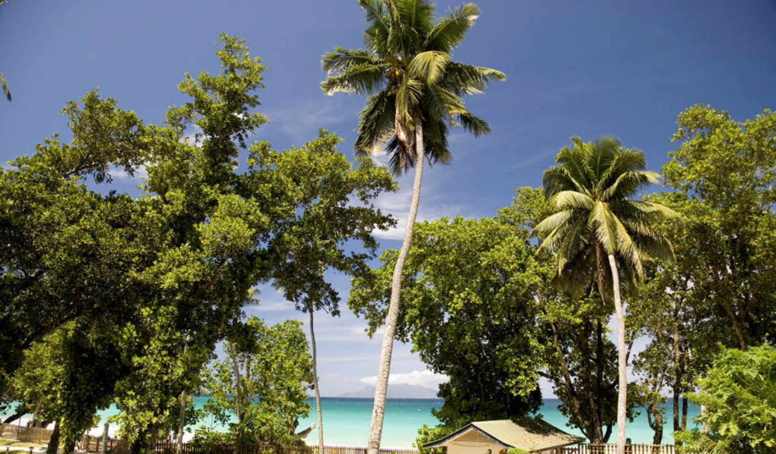
På Mahe kan I bo på Augerine, hvor der venter en flot havudsigt

Standard: Augerine Hotel, Sea View Room Deluxe: Carana Beach Hotel, Ocean View Chalet