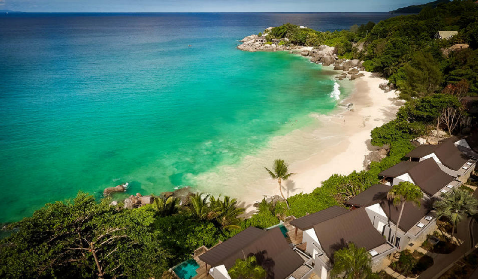
Hotelvej på Mahé, Carana

Standard: Les Villa D'Or, One Bedroom Villa Deluxe: Hotel L'Archipel, Superior Room