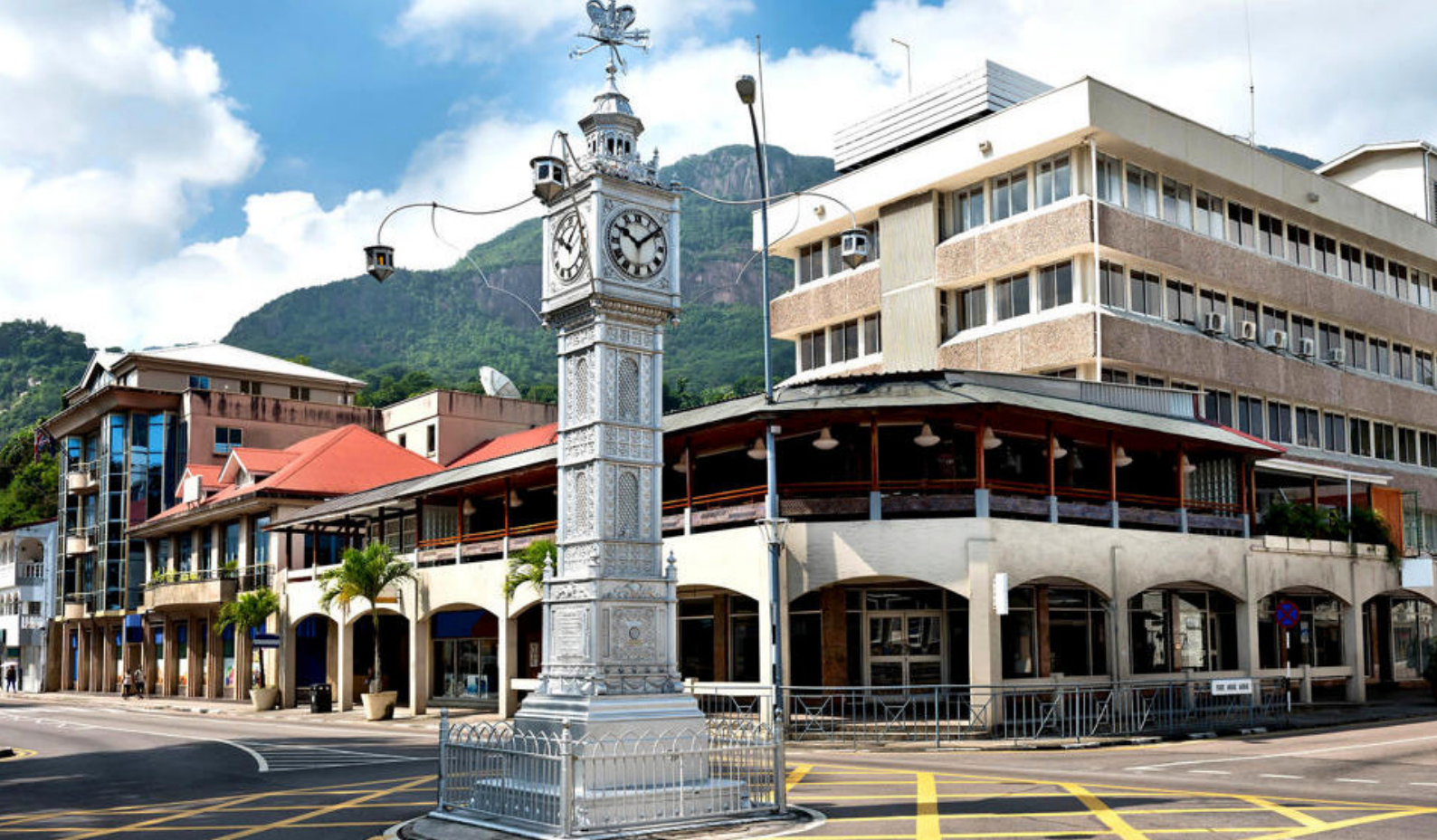
Little Big Ben i Mahé