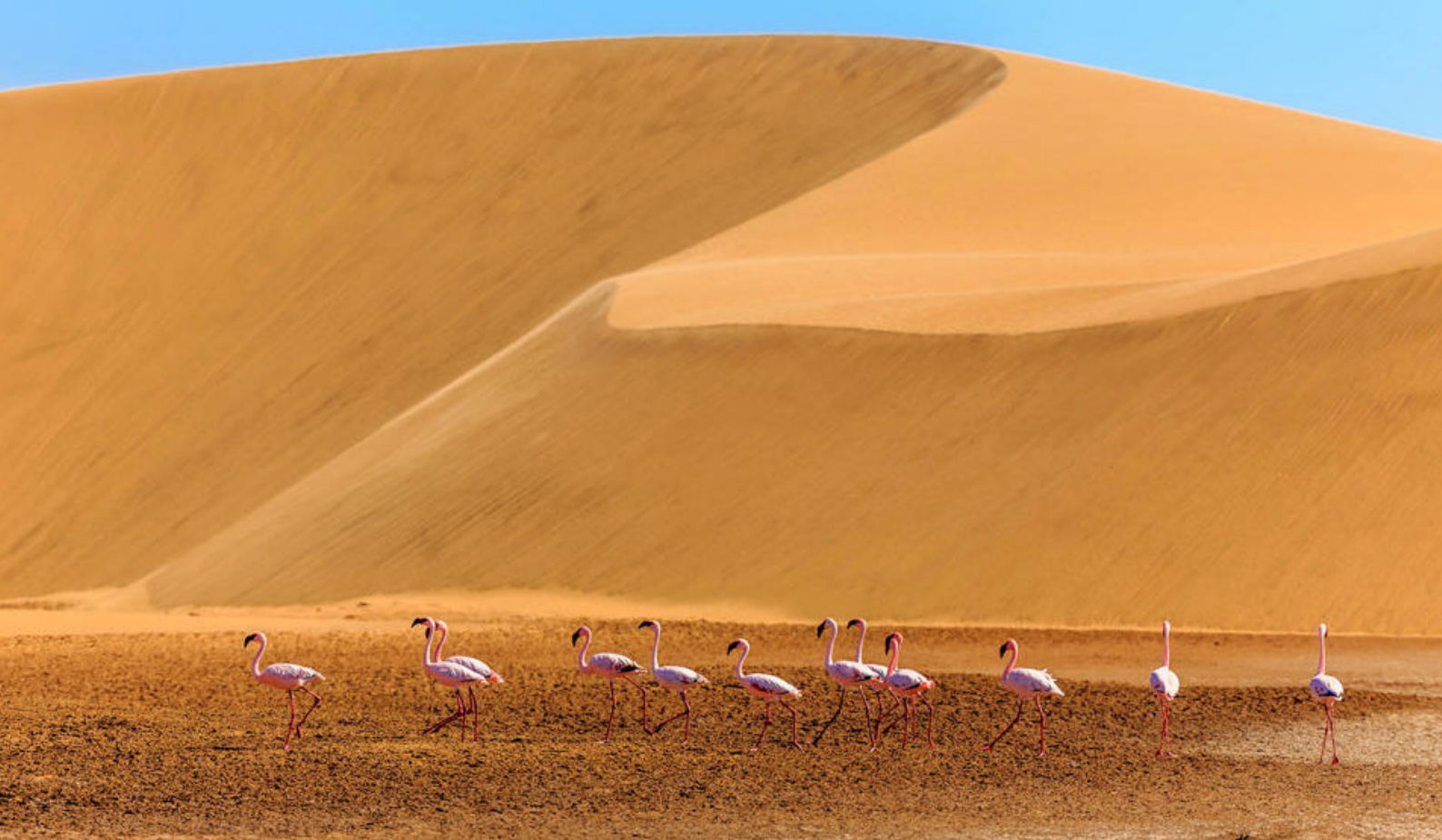
Flamingoer i Kalahari-ørkenen i Botswana

Måltider inkluderet: Morgenmad, frokost og middag Overnatning: Shearwater Explorers Village