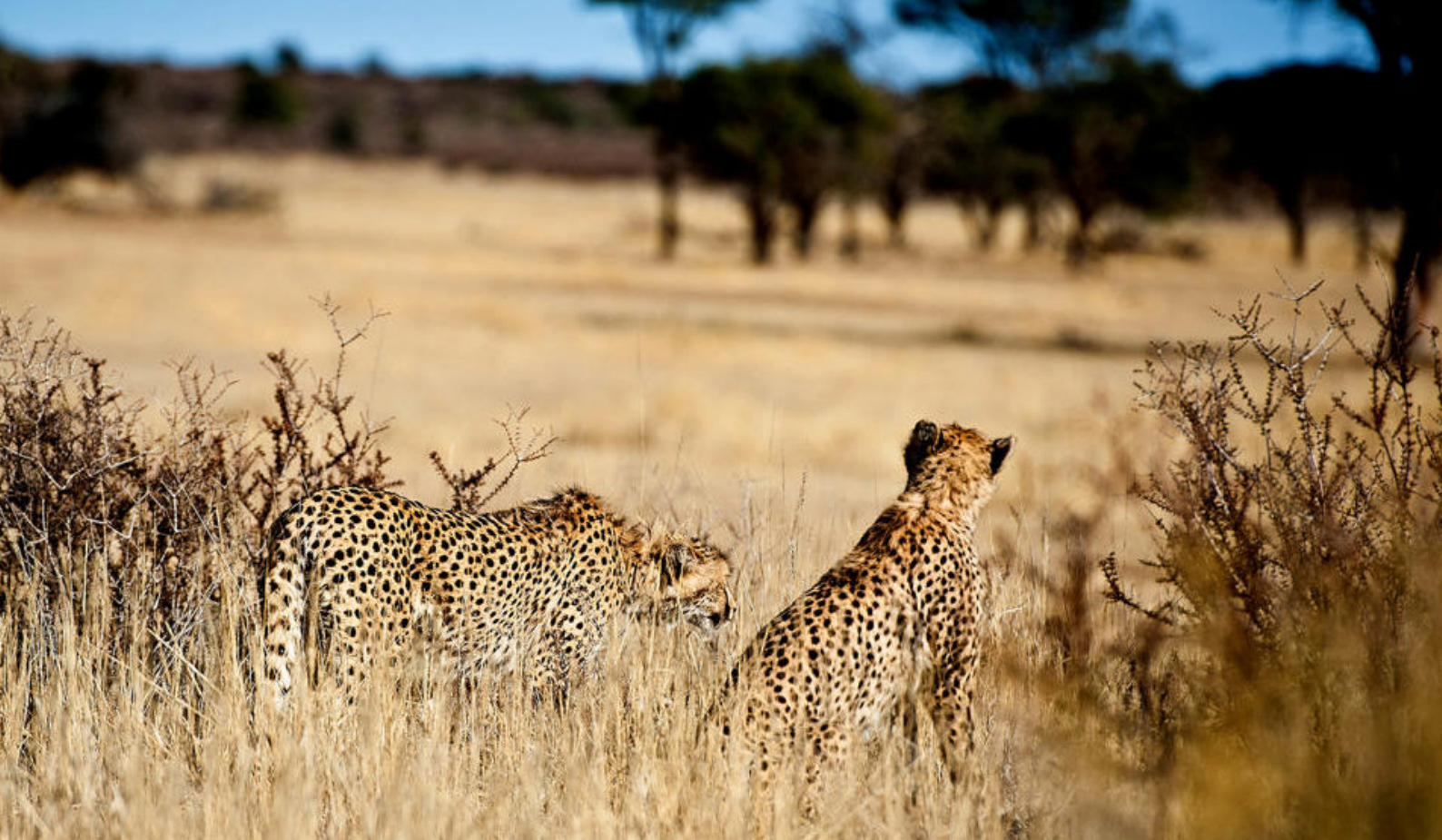
Også vilde dyr i Kalahari ørkenen - her geparder

Først på aftenen ankommer I til Nata, hvor I skal bo i nat, når safarientyret fortsætter.