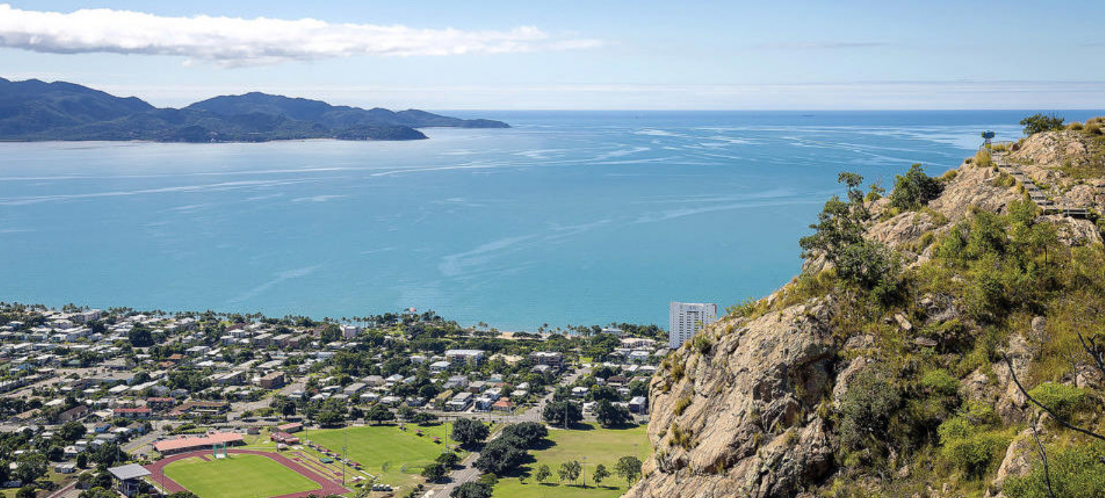
Besøg smukke Townsville

hvor regnskoven møder havet. Stranden er 14 km. lang, og vi anbefaler I går noget af vejen for at nyde området, før I tager en dukkert i det skønne hav.