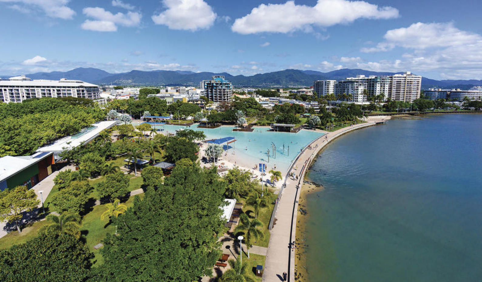
Cairns i tropiske Queensland

strandbyen Noosa. Tag jer tid til at udforske hovedgaden Hasting Streets charmerende butikker, gallerier og caféer, og find unikke souvenirs eller nyd en afslappet frokost med udsigt over stranden.