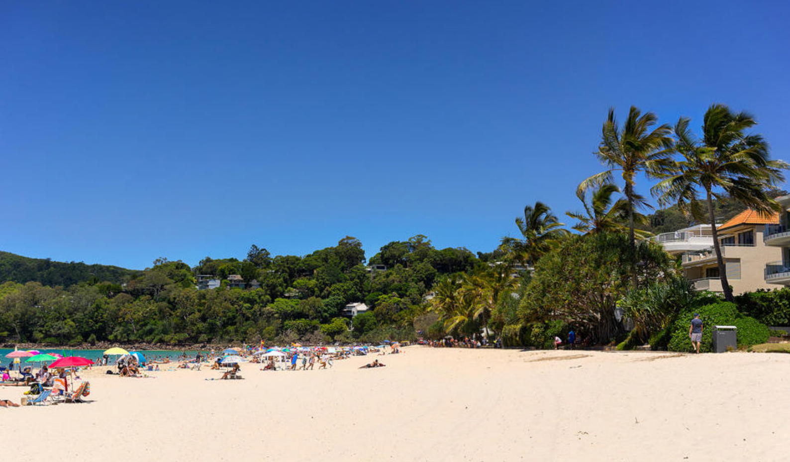
Bilferie i Queensland | Noosa Heads