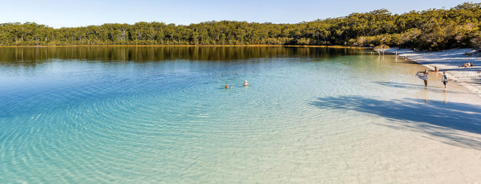
Lake MacKenzie, Fraser Island | Foto: Tourism & Events Queensland

langs Queensland's kyst. Dyk ned i det fantastiske univers og oplev et af verdens naturvidundere på tættest hold. Her kan I se flere tusinde arter af eksotiske fisk, der svømmer ud og ind af det imponerende rev, og er I heldige, kan I også spotte en havskildpadde. Iagttag de forunderlige koraller, men rør dem ikke, da blot en lille berøring fra mennesker kan dræbe korallerne i en diameter på en halv meter!