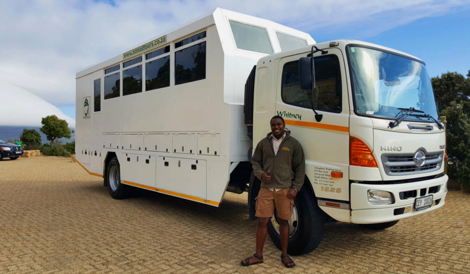
På tur rundt i Uganda.

Parkens diverse økosystem, som består af skove, savanner og vådområder er nemlig et optimalt habitat for mange forskellige fugle som f.eks. den sjældne og mærkværdige storkeart træskonæb.