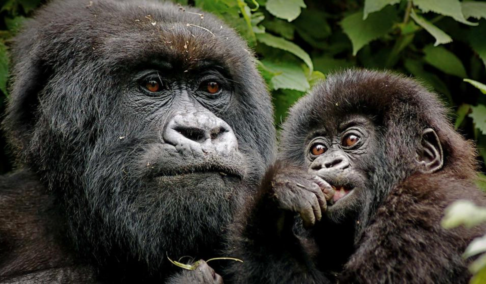
Gorillaer i Uganda

Måltider inkluderet: Morgenmad, frokost og middag Overnatning: Lake Bunyonyi Overland Resort