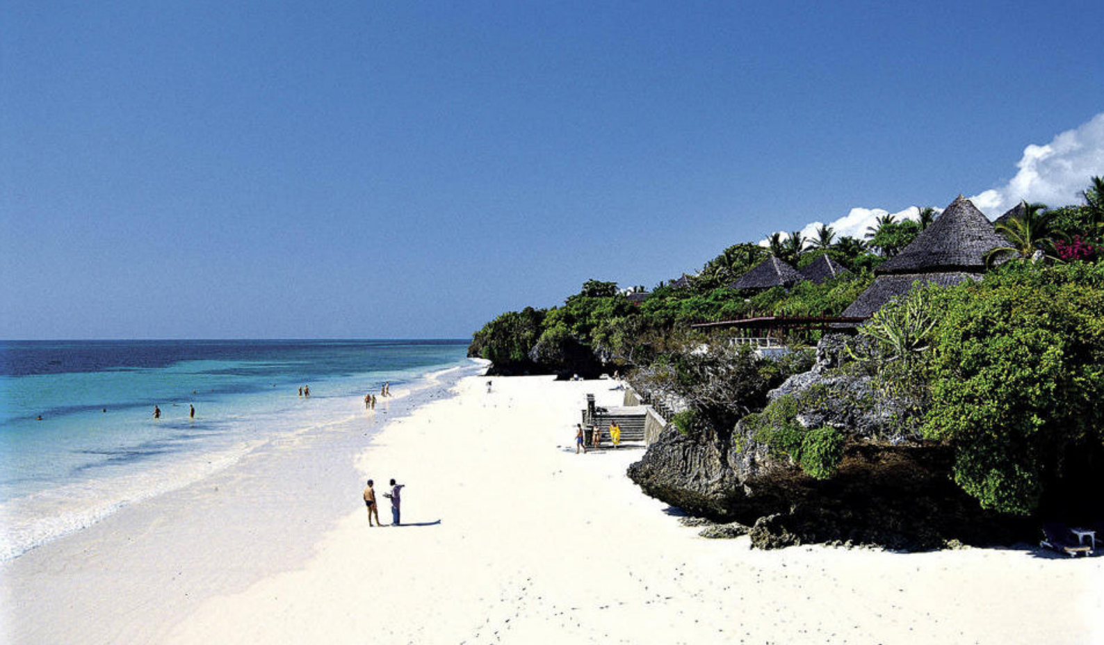
Mulighed for badeferie på Kenyakysten på Diani Beach

rejser over på det afrikanske kontinent. Livingstone boede der, inden han rejste ind til fastlandet på sin sidste rejse.