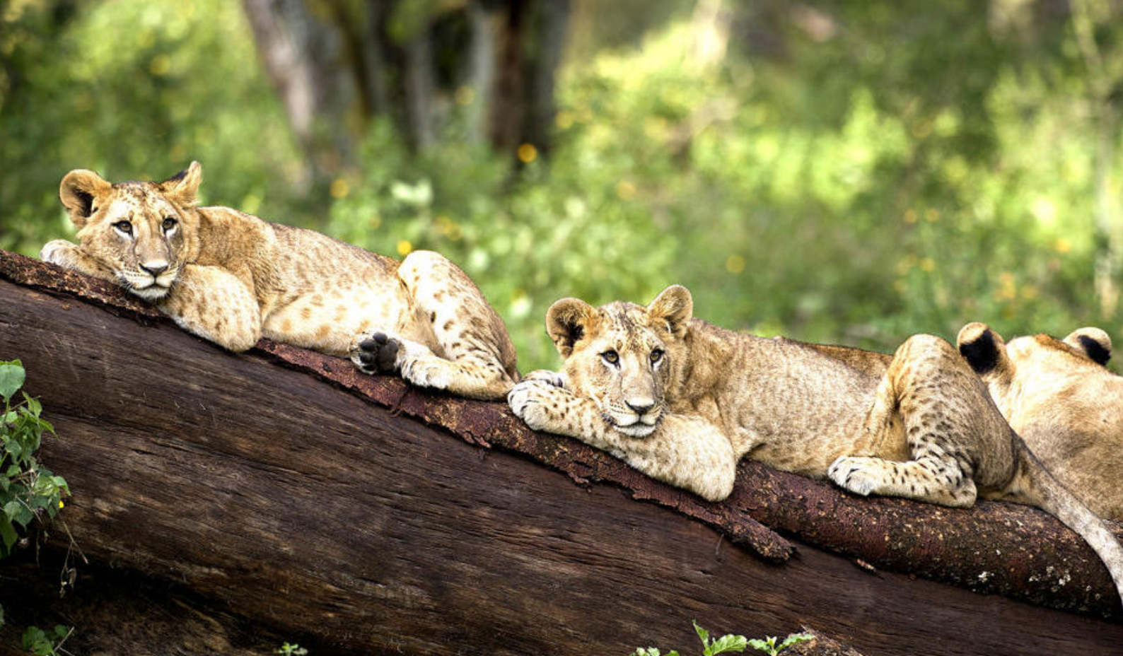
Træklatrende løver ved Lake Nakuru