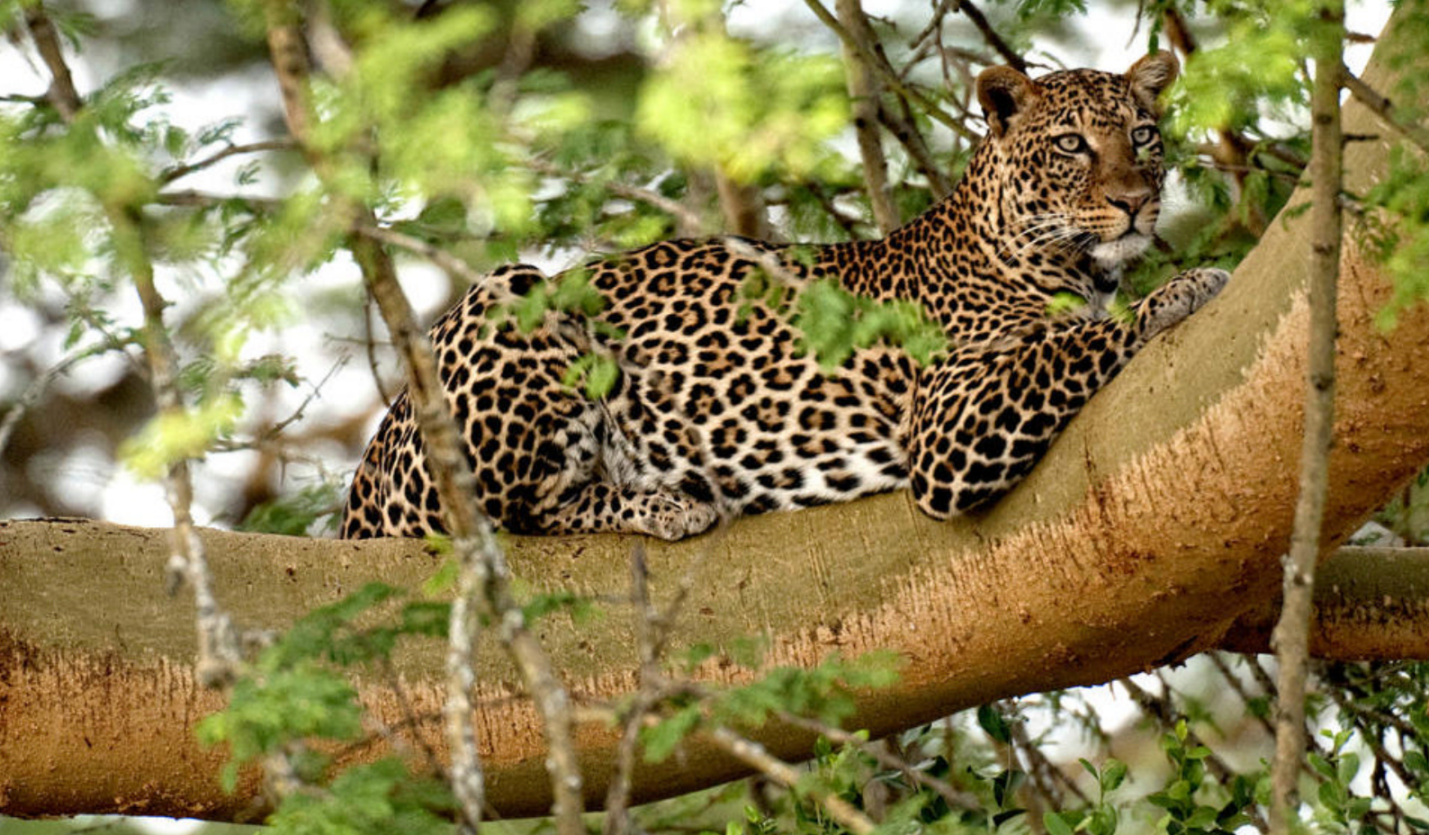
Træklatrende leopard ved Lake Nakuru