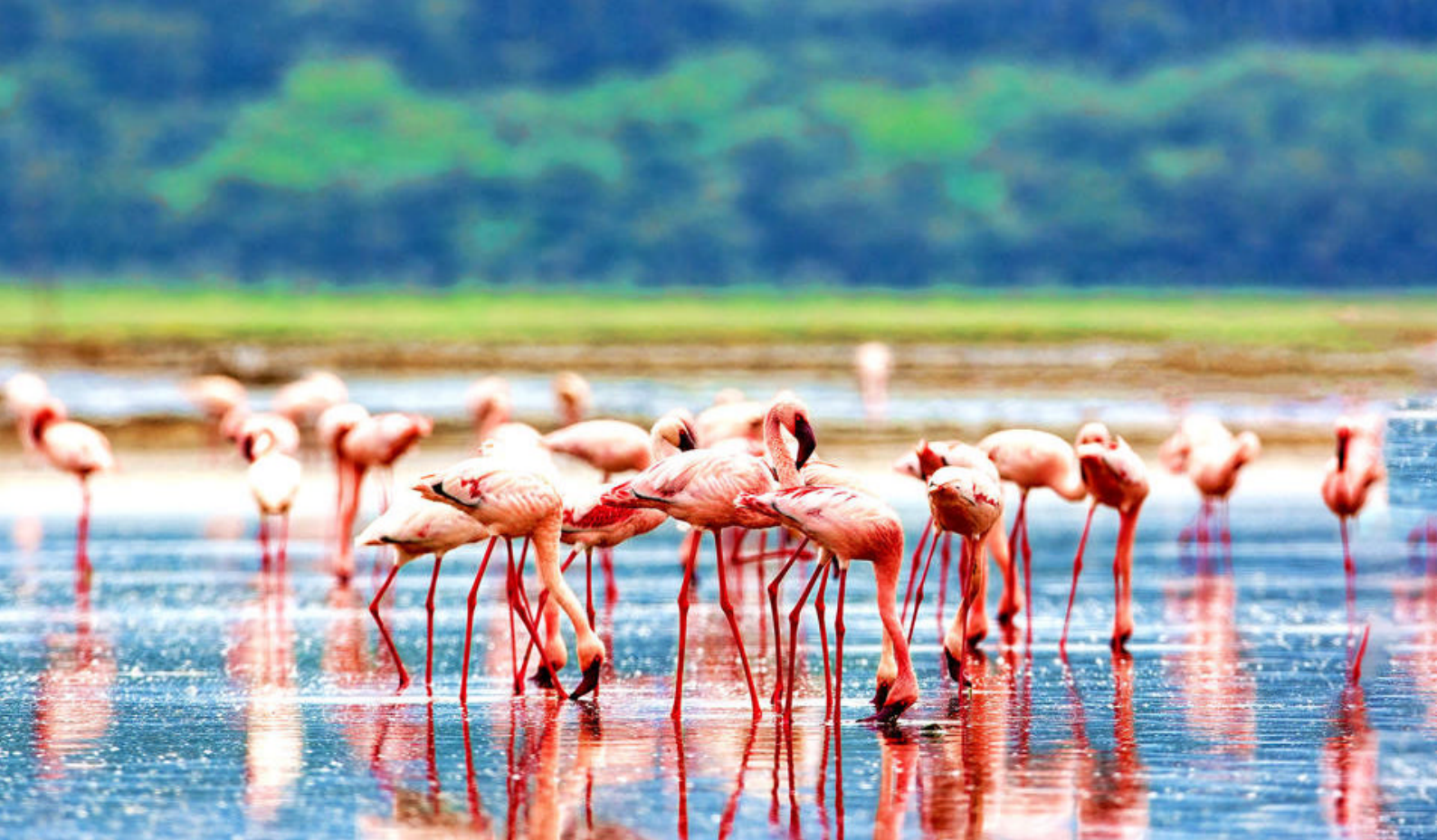
Flamingoer ved Lake Nakuru

udsigtsbalkoner. Herfra kan man være heldig at opleve elefanter, bøfler, "sorte" næsehorn, bavianer, vortesvin, forskellige antiloper samt den sjældne "bush baby".