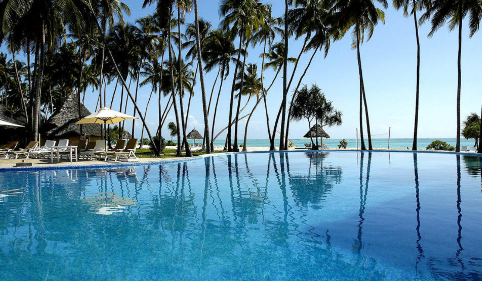
Lækker badeferie på Zanzibar

Også forplejningen er i top på alle niveauer og især glimrer den lækre Chui-Grill, som har vundet mange priser. Og skulle man endelig blive træt af bare at drive og dase, tilbydes der masser af aktiviteter og udflugter fra resortet.