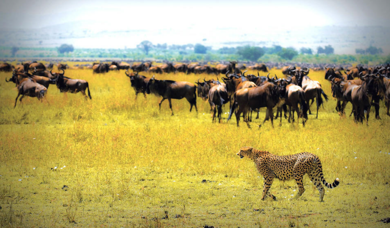
Masser af dyr på Masai Mara