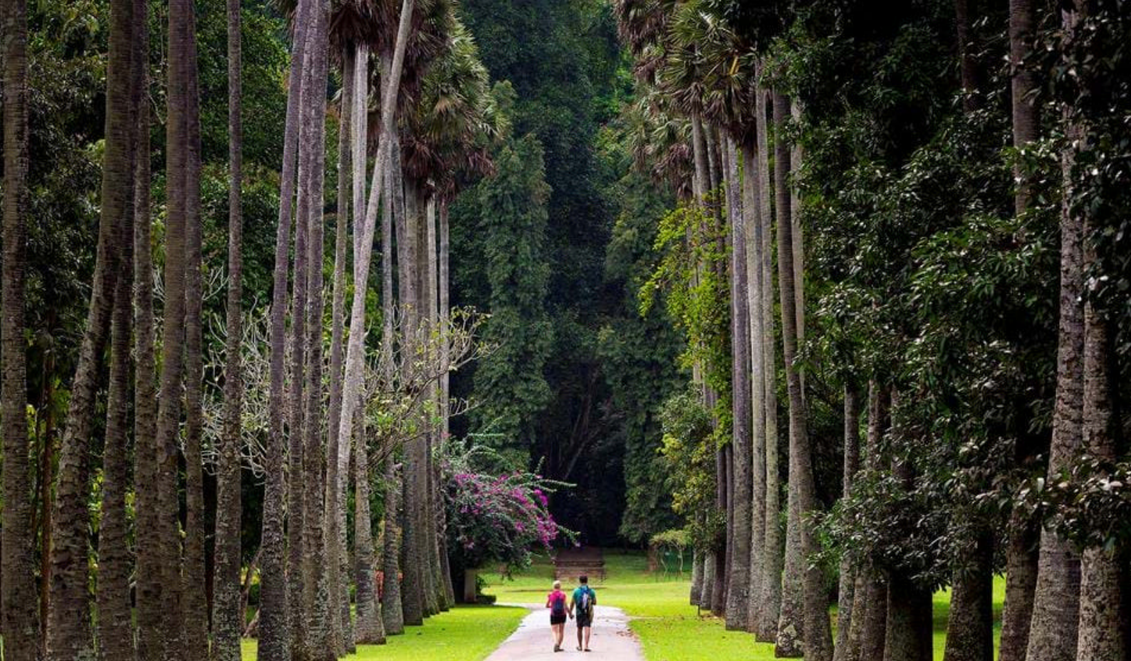
Besøg i Peradenya Botanical Garden i Kandy