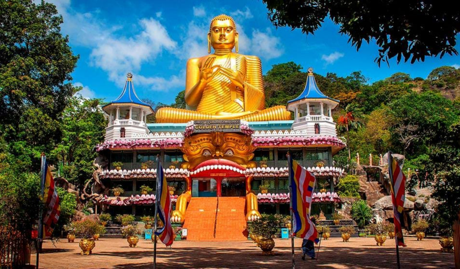
Dambullas Gyldne Tempel

Temple. Her findes Buddhaer i alle positioner: Stående, liggende, siddende, og hulen er fuld af vægmalerier i primært røde og gule farver.