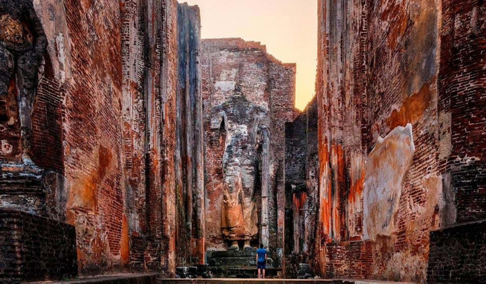
Den gamle kongeby Polonnaruwa

Efter morgenmaden checker I ud fra jeres hotel og gør klar til rejsens fortsættelse og dagens nye oplevelser. Turens slutmål i dag er den historiske by, Kandy, med Sri Lankas helligste tempel, Tandens Tempel = Temple of Tooth. På vejen til Kandy er der indlagt stop i Dambulla, hvor I skal se og opleve det UNESCO-beskyttede tempel, The Dambulla Golden Temple & The Cave Temple. Der er tale om et tempelkompleks med to templer, hvor det gyldne tempel ligger ved foden af The Cave Temple. Dette er indgravet i klipperne bag, men højt hævet over det gyldne tempel.