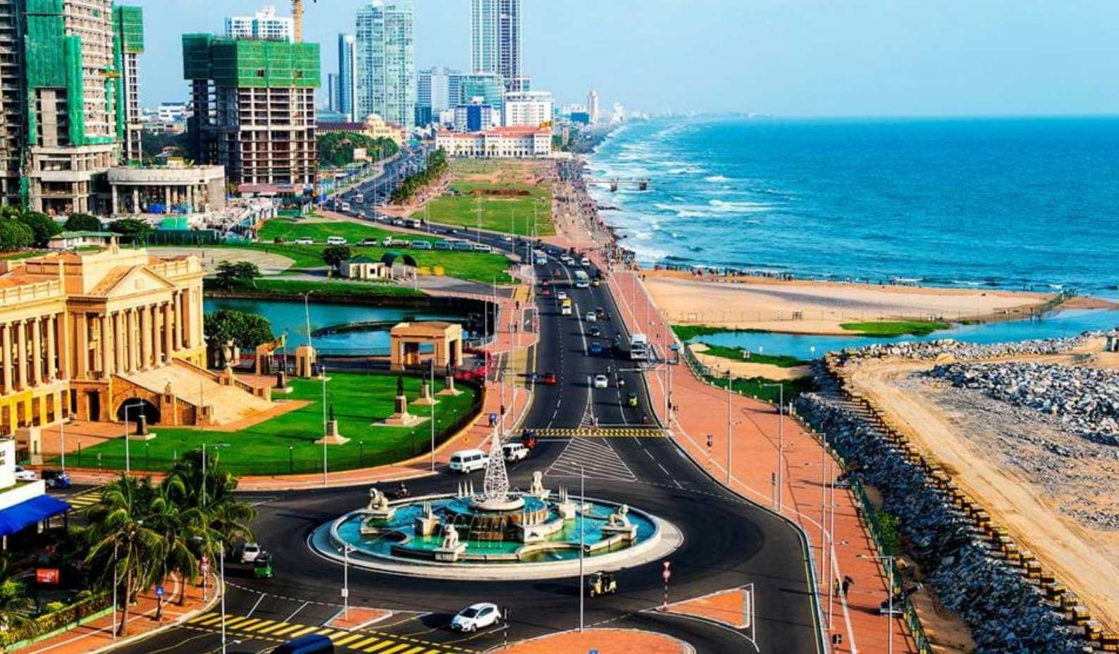
Oplevelserne begynder i Colombo (her) eller Negombo