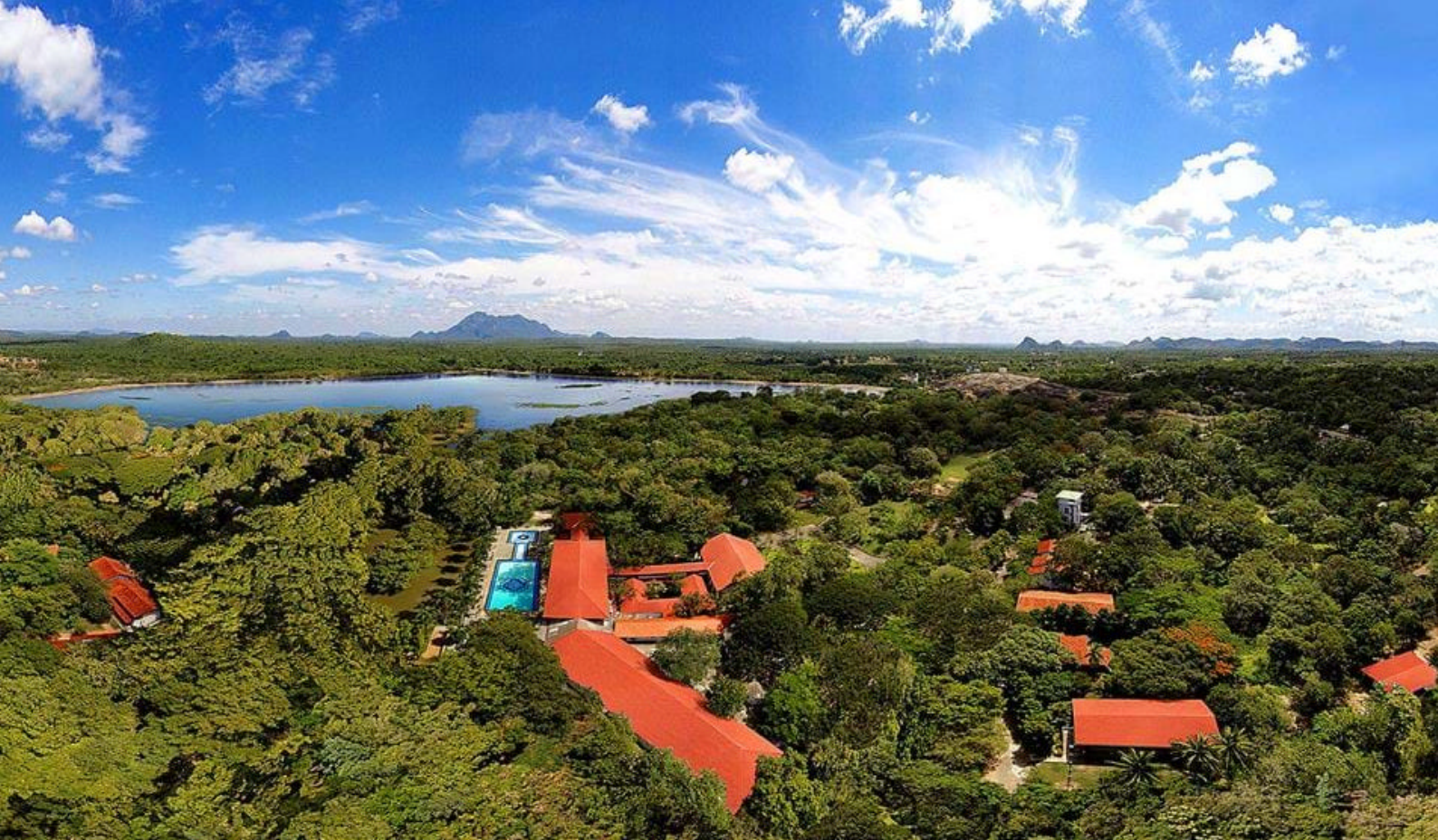
Cinnamon Lodge i Habarana

Aktiviteter inkluderet: Sigiriya Rock Fortress 'Løveklippen'