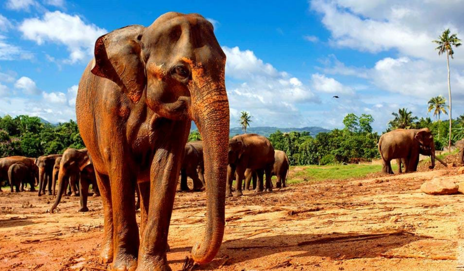
Elefanter i Udawalawa National Park

Bentota lagunen. Et dejligt sted at feriere. Af større attraktioner kan nævnes Galapota Temple med en enorm Buddhastatue og de smukke haver Lanugana og Bevi's Brief Garden.