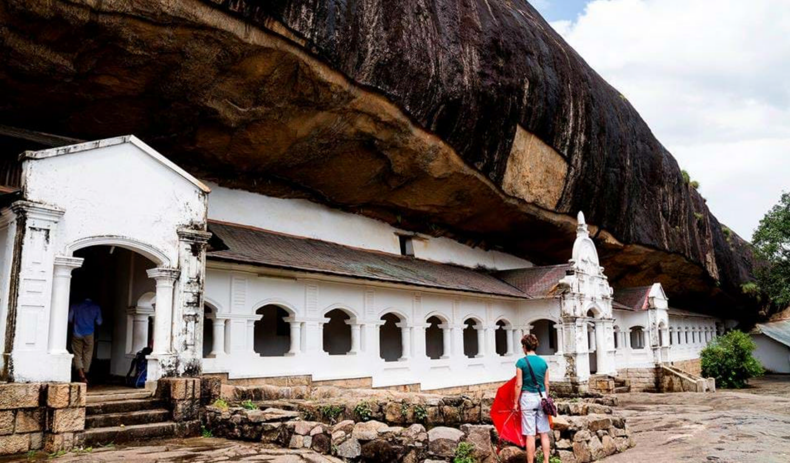
Dambulla Cave Temple

Den botaniske have blev oprindeligt bygget som en have til kongen og blev udvidet af englænderne efter deres overtagelse af Kandy i 1815. Haven er ca. 0,6 km 2 stor og byder på helt fantastisk diversitet af træer, eksotiske planter og blomster. Nyd frokosten i havens Garden Café og lad jer imponere over roen, den afslappede atmosfære og de frodige omgivelser. Efter frokosten returnerer I til jeres hotel for afslapning og tid på egen hånd resten af denne eftermiddag. Det vil være oplagt evt. at tage ind til Kandy og blot slendre rundt og opleve det myldrende og livlige gadeliv. Får I lyst til en drink kan vi anbefale rigtig kolonistemning på The Royal Bar & Hotel, der ligger ikke så langt fra Tandens Tempel.