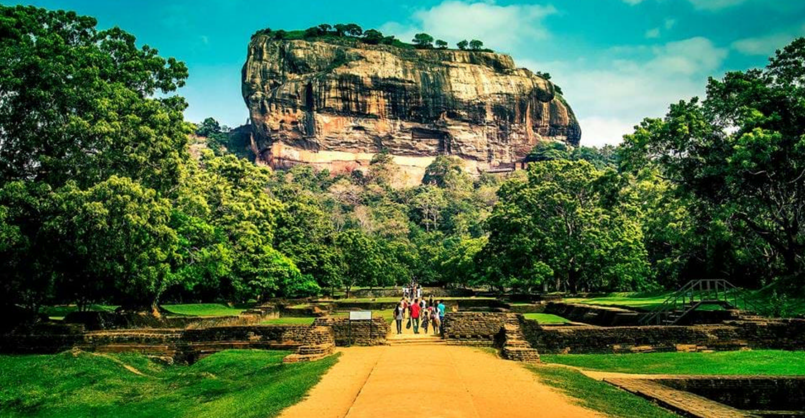
I besøger Sigiriya Rock Fortress nær Habarana

menneskeskabte vandreservoirs, som tjener til at sikre vand nok til de forskellige landsbyers landbrugsarealer. Jo længere I kommer frem mod Habarana bliver landskabet lidt mere 'bakket', og ikke sjældent vil I kunne se aber, bøfler, øgler og eksotiske fugle - og hvem ved måske en elefant, der dukker op fra budskadset i vejsiden. Så stopper al trafik! Læg mærke til den enorme frodighed og tætte vegetation, som I møder, og som er en stor kontrast til fx. Thailand og Malaysia. Fremme i Habarana er der indkvartering på Cinnamon Lodge Hotel, hvor I skal bo de næste to nætter.