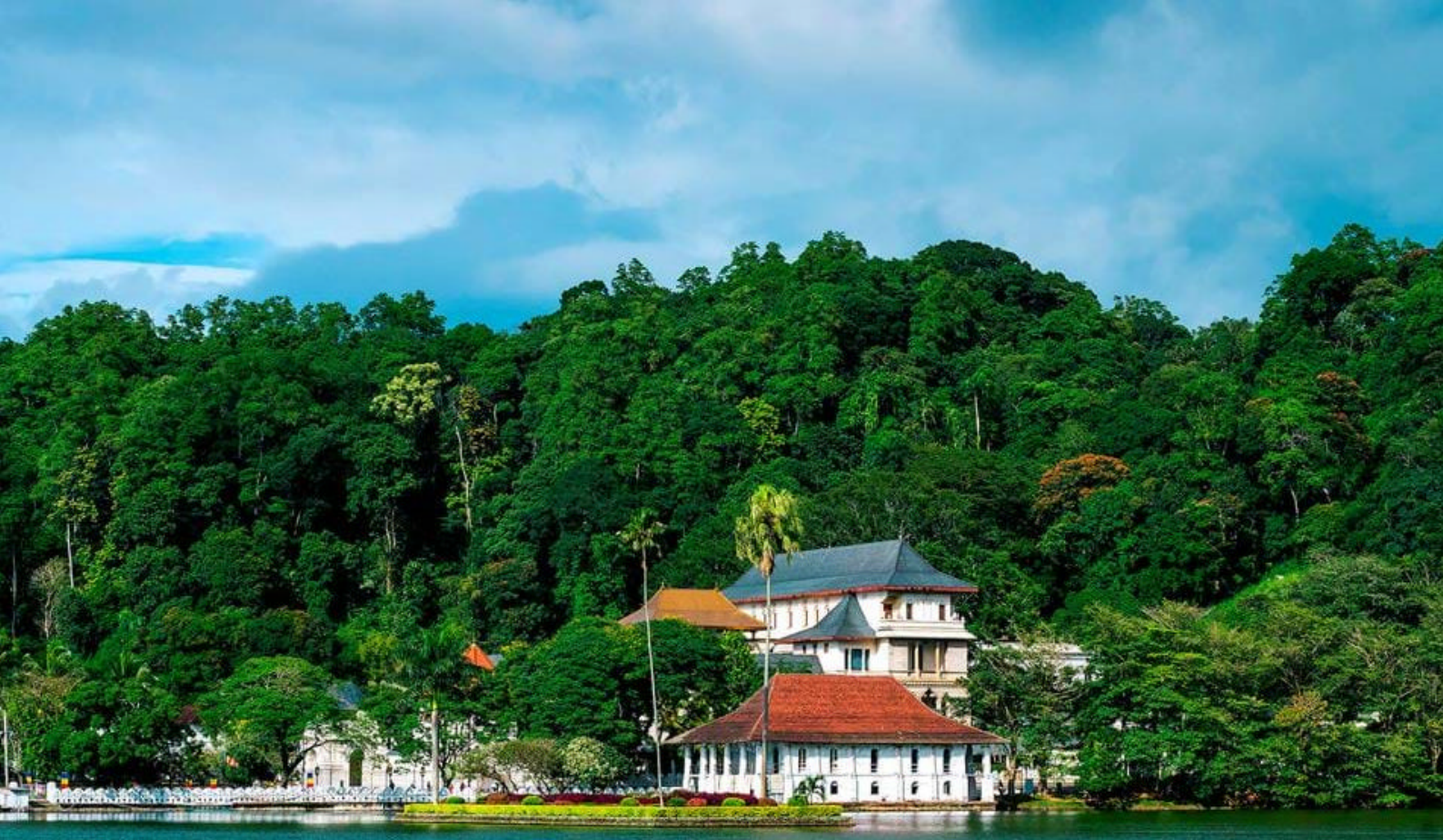
Tandens Tempel i Kandy

bare se sig omkring i byen, så forstår man hvorfor, i det adskillige bygninger er opført i edwardiansk eller victoriansk byggestil. Intet sted fornemmer man det tydeligere end ved Hill Club eller ved en gåtur i Victoria Park. Heroppe i højderne er temperaturen meget behagelig med en gennemsnitstemperatur årligt på ca. 20 grader. Men der kan dog være køligt om morgenen og om aftenen, og ikke sjældent ligger der en let tåge over bjergene. Men her er meget smukt med dale og bjerge med temarker, så langt øjet rækker. Området betragtes, som det mest betydningsfulde for teproduktionen i Sri Lanka. I landskabet omkring byen ligger Sri Lankas højeste bjerg Pidurutalagala med sine 2524 moh.