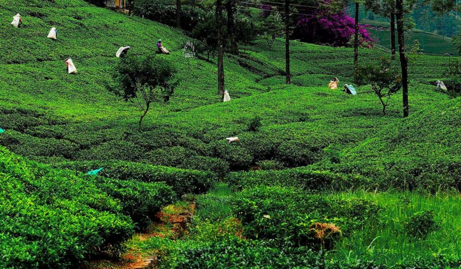
Temarker overalt i Sri Lankas højland på vej til Nuwara Eliya