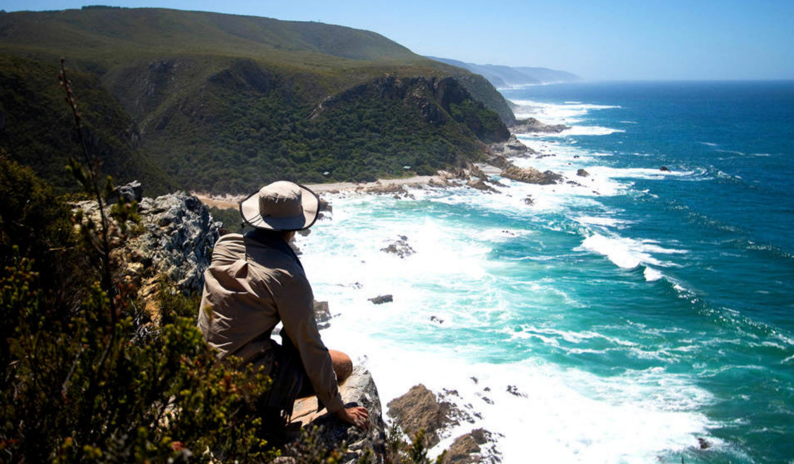
Tsitsikamma, Otter Trail

næsehorn, plettede hyæner, leoparder og flere forskellige typer af antiloper.