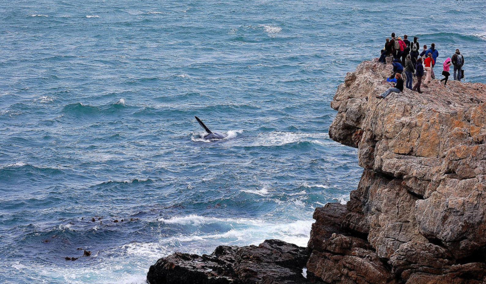
Sydlige rethvaler ud for Hermanus

Slutmålet er den smukke nationalpark Tsitsikamma.