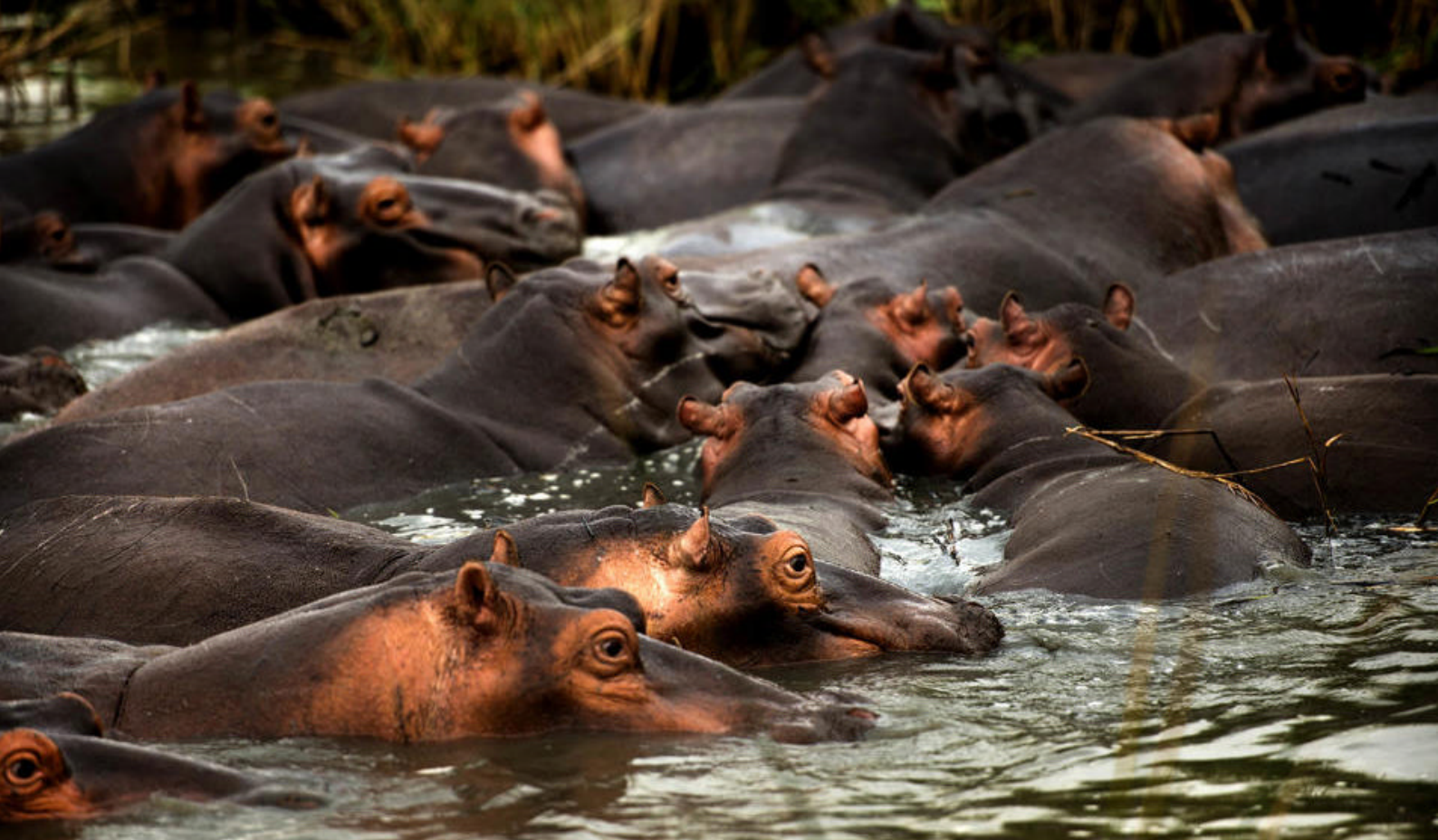
Flodheste i Krugerparken

I ender dagen i Cape Town, hvor denne fantastisk rundrejse med Nomad også slutter.