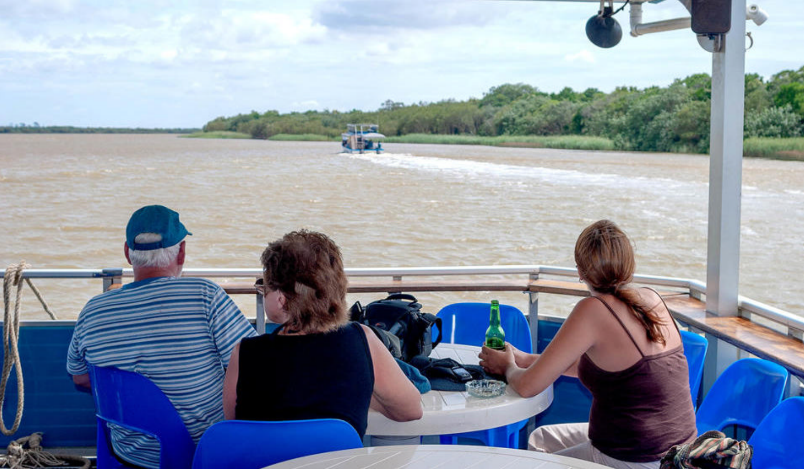
Sejltur på St. Lucia søen i iSimangaliso National Park