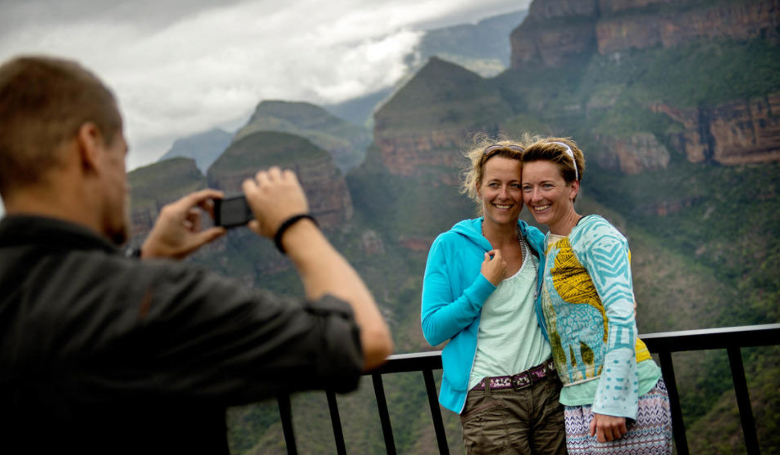
Kørsel ad Panoramaruten