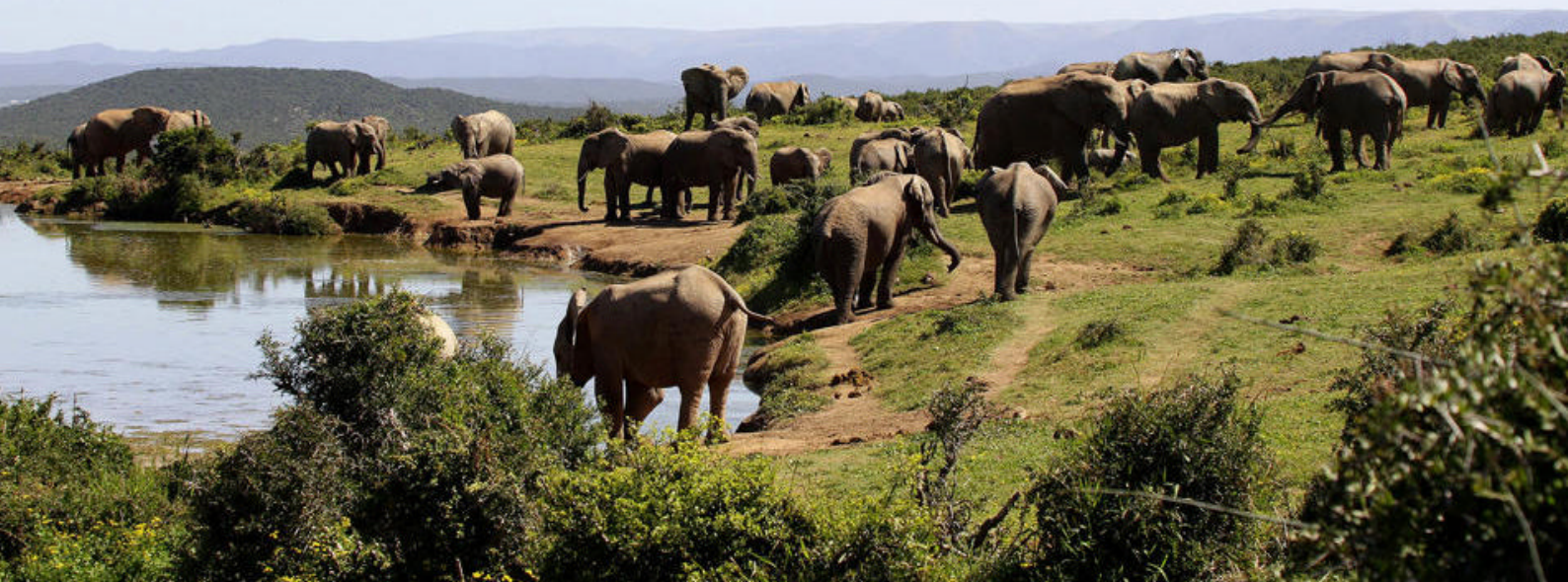
Addo Elephant National Park

Måltider inkluderet: Morgenmad og middag Overnatning: Semonkong Lodge