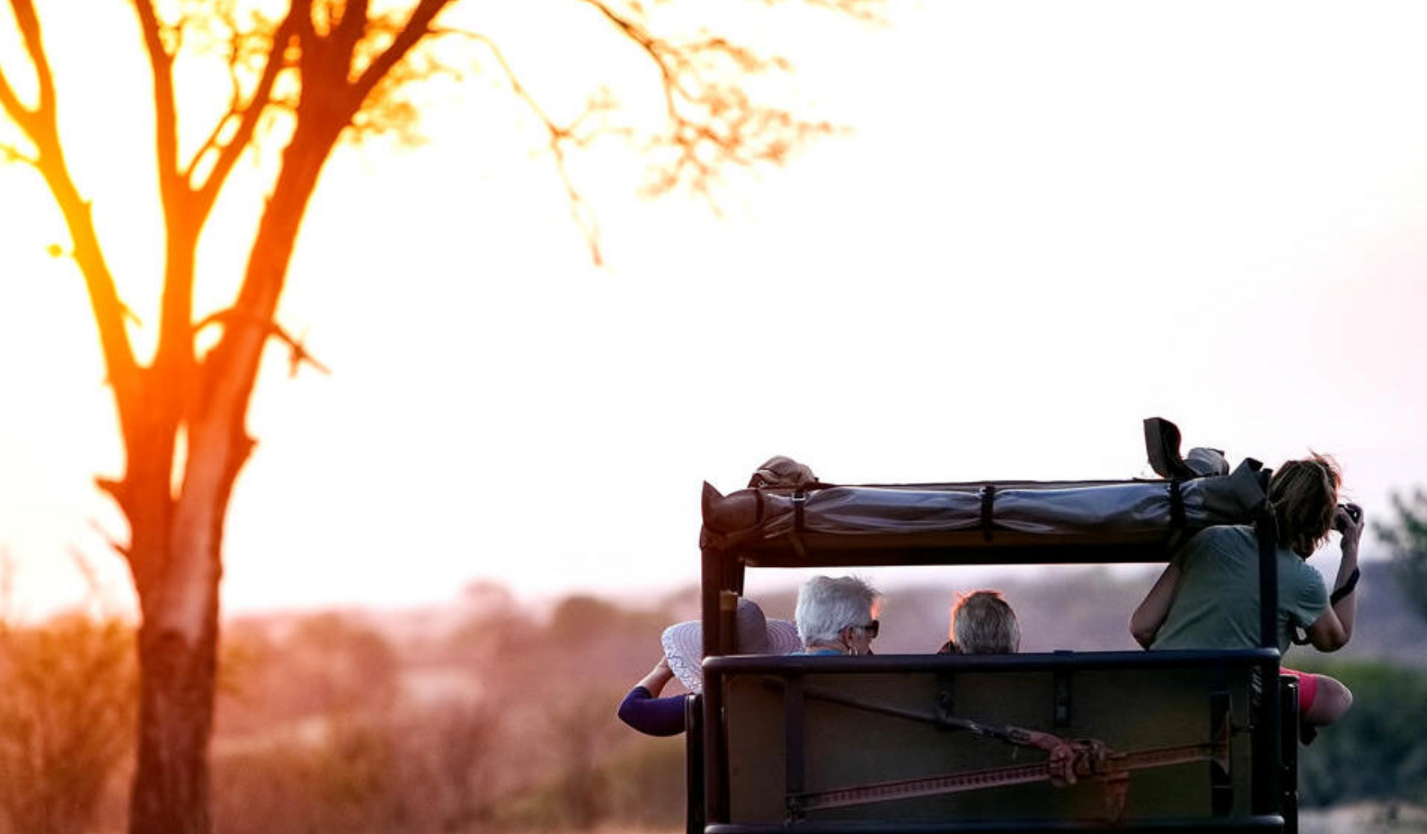
Safari i Krugerparken

km. Området ved Oudtshoorn er desuden berømt for sine strudse.