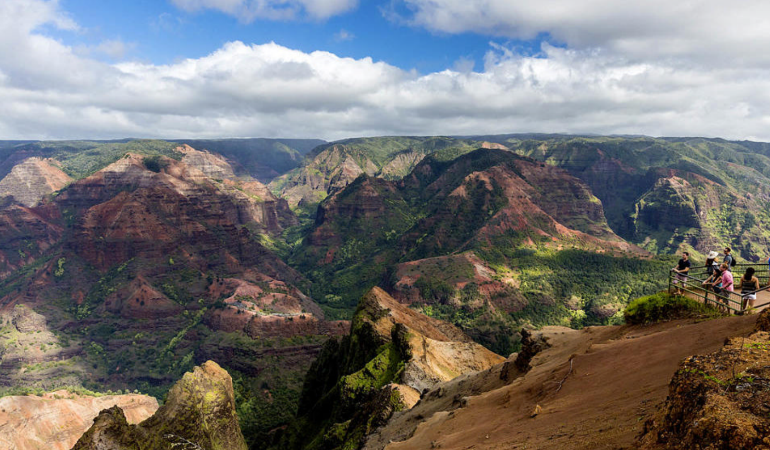
Waimea Canyon på Kauai - Hawaiis svar på Grand Canyon

Tiden er helt jeres egen på Maui. Vi kan foreslå to herlige udflugter på Maui (tillæg til prisen):