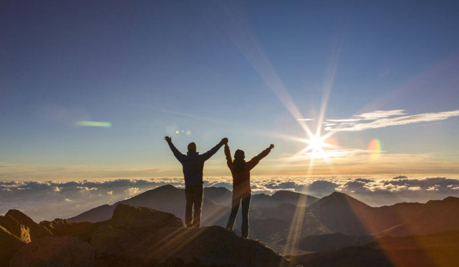
På toppen af Haleakal? på Maui ved solopgang

Big Island er den største og yngste af Hawaii-øerne og er bemærkelsesværdig for mere end blot sin størrelse. Her får I bl.a. mulighed for at opleve en af verdens mest aktive vulkaner, Kilauea og gå lange ture i strandkanten på fantastiske, sorte sandstrande.