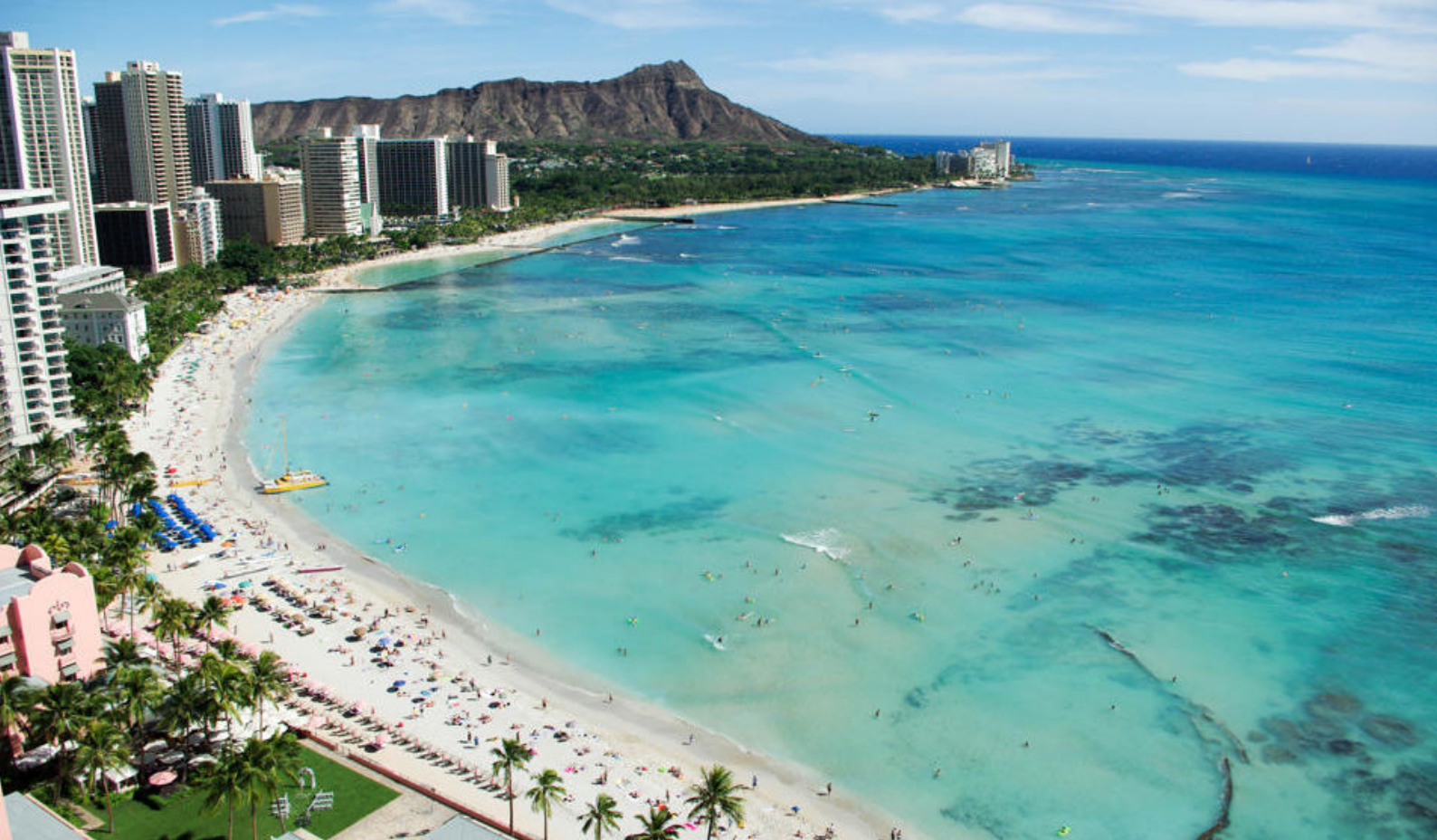
Wakiki Beach og Diamond Head på Oahu