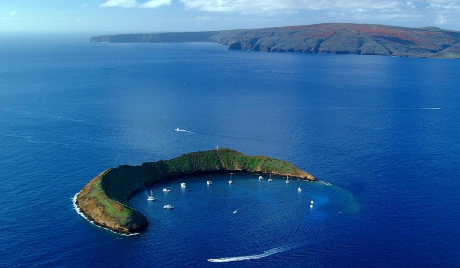
Molokini-krateret - et fantastisk sted at dykke og snorkle

håndgraverede marmorvæg med navnene på de sømænd, der stadig ligger begravet i vraget nedenunder.