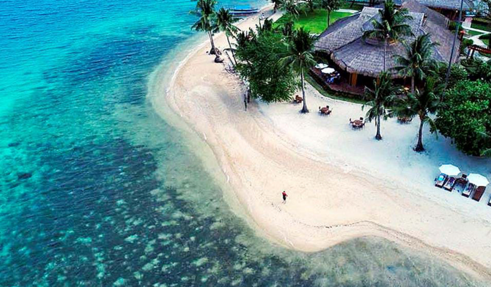
Fridays Resort i Puerto Galera