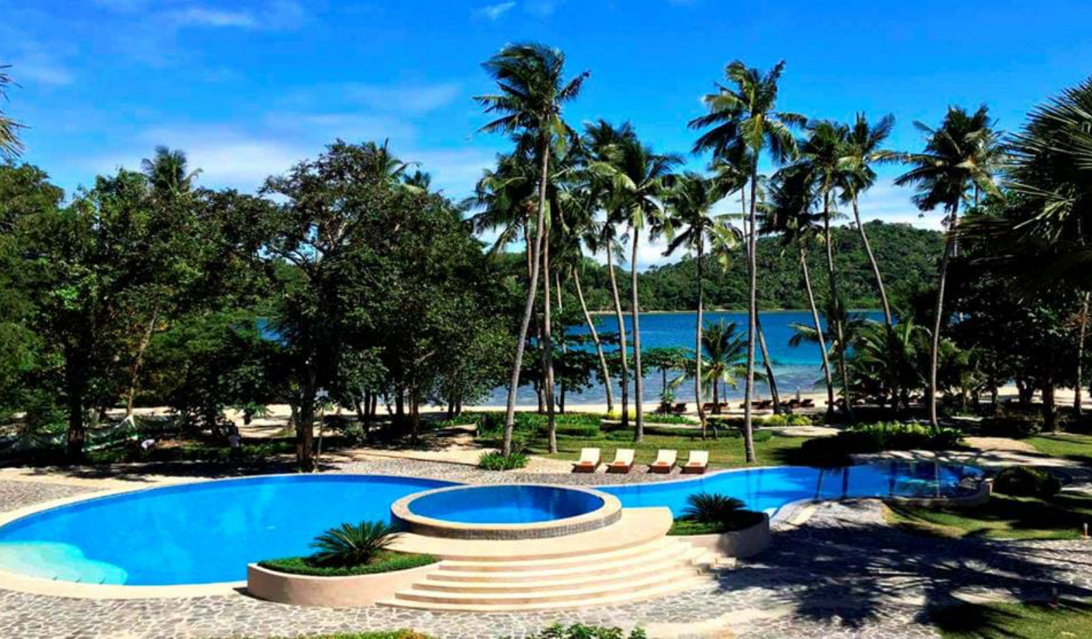
Fridays Resort i Puerto Galera