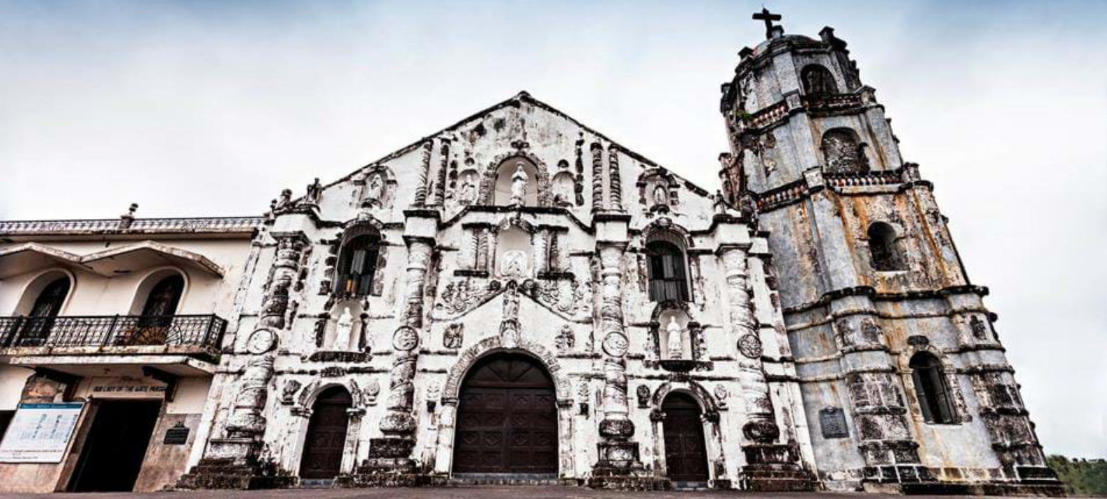
Gammel spansk kirke i Legazpi

naturoplevelse, som samtidig er fuld af kulturelle indtryk fra lokallivet omkring vulkanen.