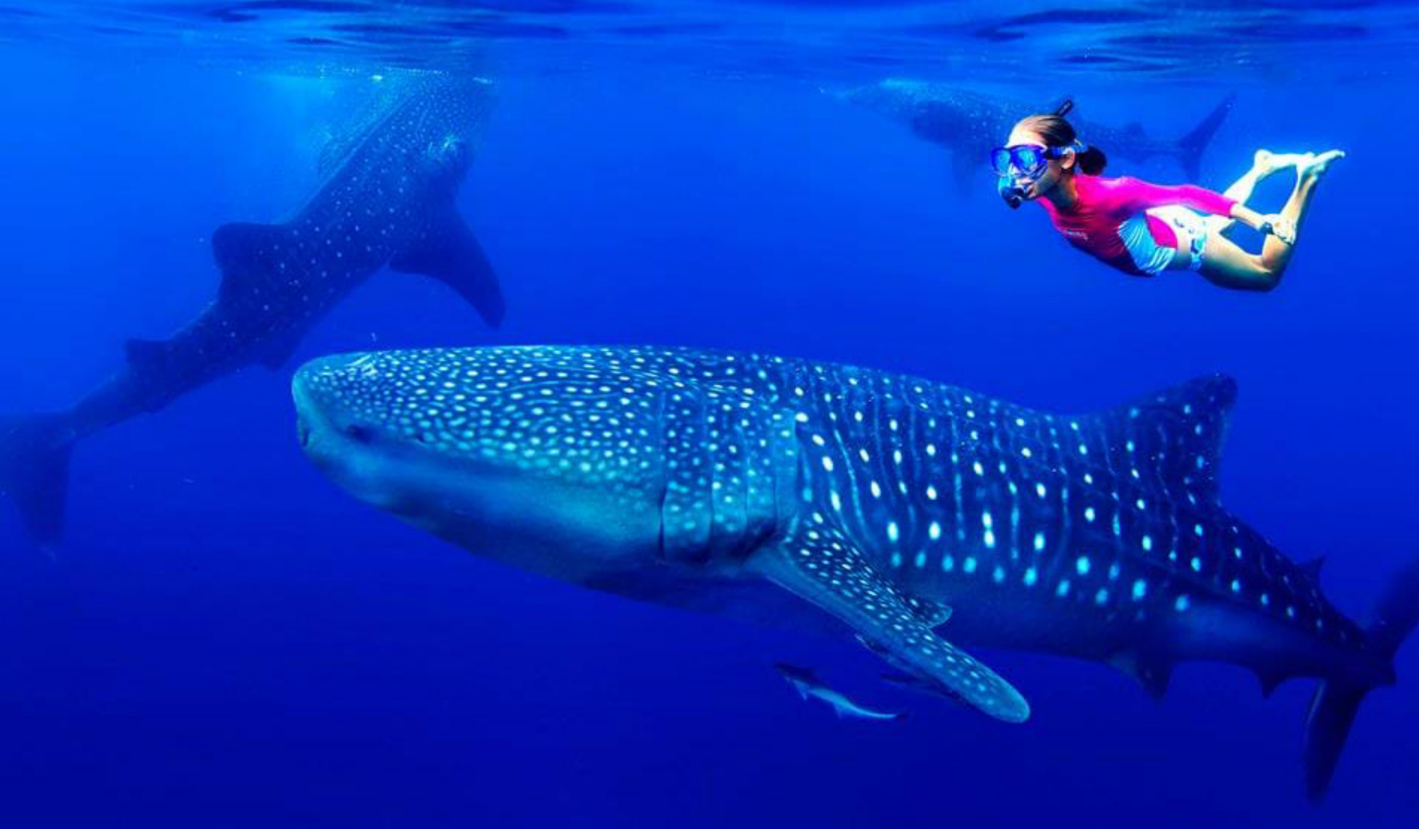
Snørkle med Hvalhajer ved Donsol

Elysia Beach Resort er et charmerende hotel, hvor I kommer til at bo i autentiske pælehuse, kaldet Nipa Huts. Værelserne er enkle og rustikke. Resortet er det eneste med pool i området. Her er alle forudsætninger for at få slappet godt af. Stranden ved Elysia Beach Resort er sort sandstrand på grund områdets vulkanske oprindelse.