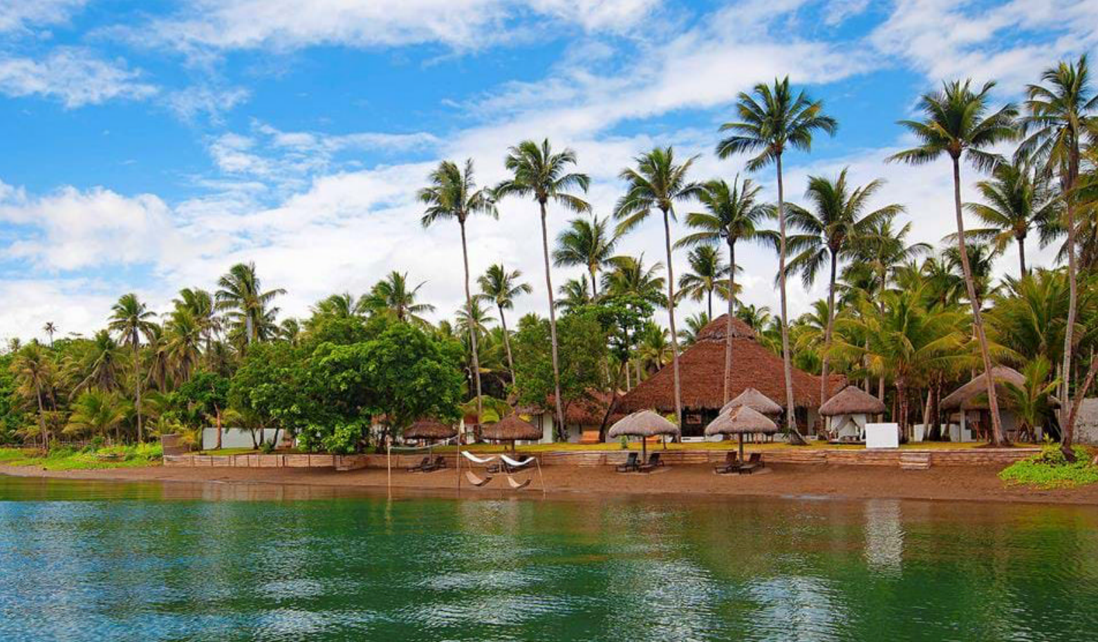
Elysia Beach Resort i Donsol

er også her at ungerne ruges ud. Hun kan have op til 300 kæmpeæg i sig på én gang. Når ungerne kommer ud af æggene er de typisk 65 cm lange. Ungerne bliver typisk inde i moderen et stykke tid, inden de fødes rigtigt og svømmer ud i havet.