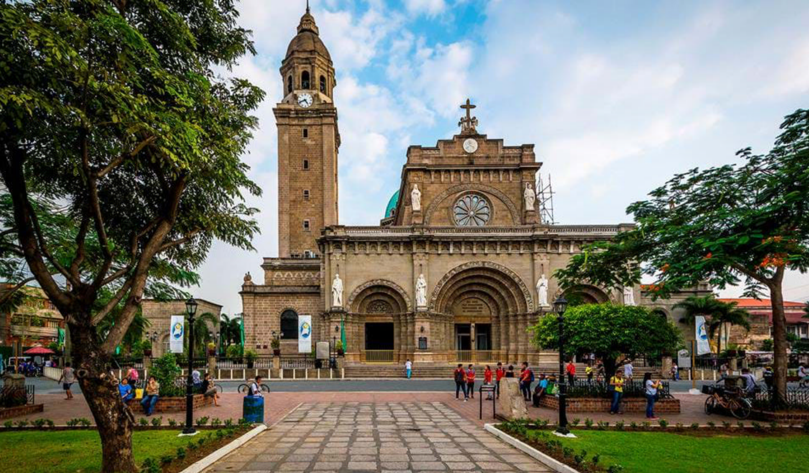
Den gamle katedral i Manila

bydel, der lå indenfor fæstningsmurene. Det var spanieren Miguel López de Legazpi, der i 1571 grundlagde Manila. Manila var således på den tid hovedstad for den nye spanske ø, og byen blomstrede rigtigt i det 17. og 18. århundrede. Byen blev dengang omgivet af 6 meter tykke mure, og indenfor murene etablerede man så de i dag berømte monumenter som Katedralen, Fort Santiago, San Agustin kirken og universitetet. Bymurene var på den tid også omgivet af voldgrave, som var der indtil 1905, hvor de blev fyldt op.