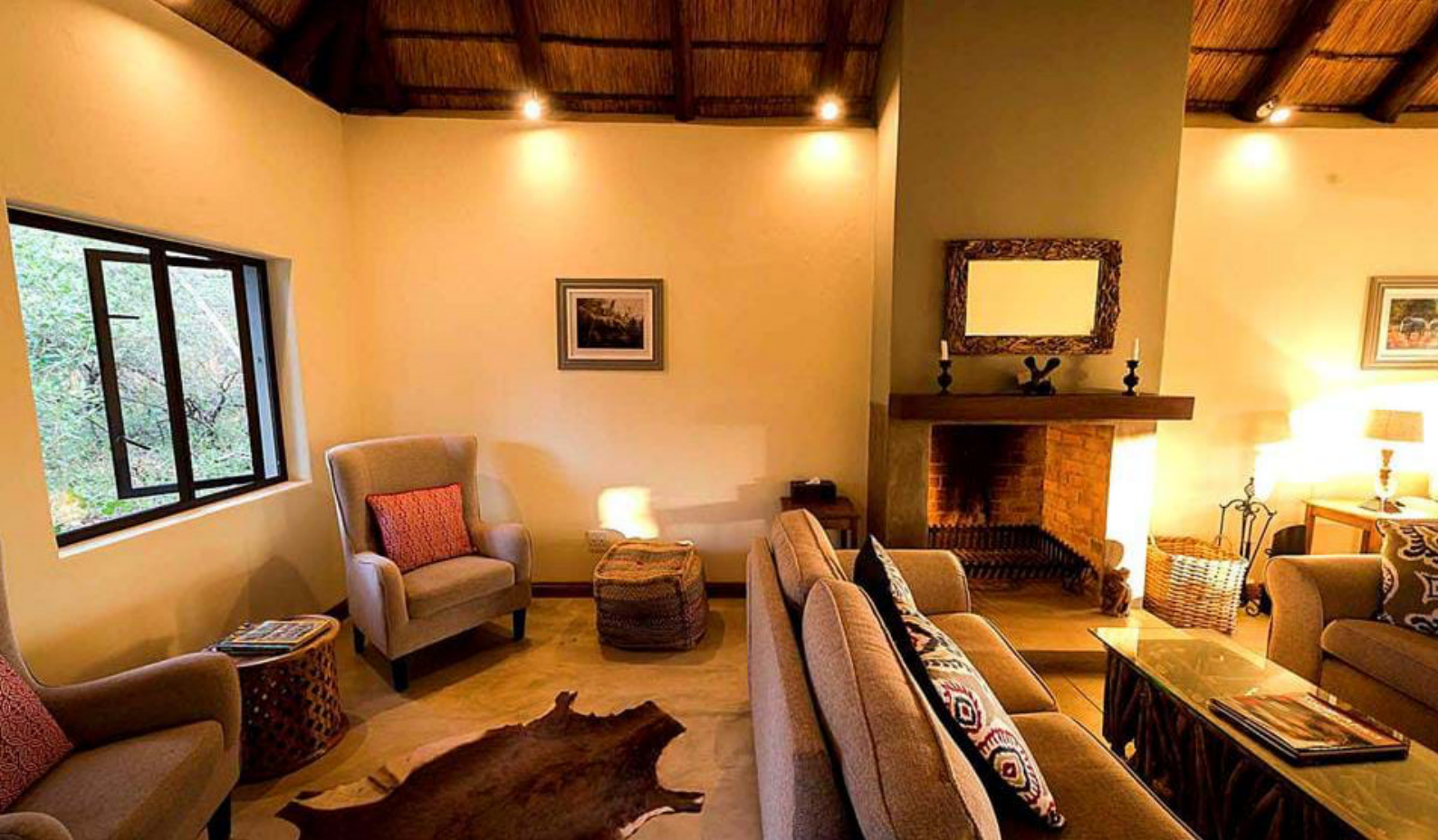
Rukiya Safari Camp | Hyggelig lounge i hovedbygningen

Der er igen tidlig afgang efter en god kop kaffe. I dag venter en fantastisk heldags safari i en af verdens største nationalparker, Kruger Nationalpark . Morgenmaden er pakket, og turen går nu til Kruger National Park i et åbent safarikøretøj.