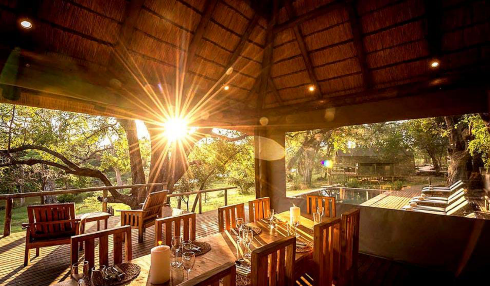
Rukiya Safari Camp | Restaurant

Balule Nature er en del af Limpopo regionen, og i dag regnes området for en del af 'The Greater Kruger Park'. Det har området ikke altid været, men for få år siden besluttede man at fjerne en lang række dyrehegn i Balule i et forsøg at give dyrene bedre mulighed for at vandre naturligt og i sidste ende bevare bestanden af forskellige dyrearter. Det er lykkedes godt, og i dag er Balule et naturreservat under stadig udvikling og et område, hvor man relativt nemt kan se The Big Five (løve, elefant, leopard, bøffel og næsehorn).