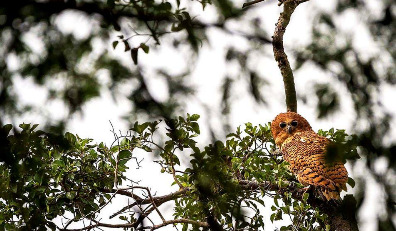
Fantastisk fugleliv i vente

Efter safarien nydes en Sundowner, og middagen i aften foregår ude i det fri, hvor I skal prøve en traditionel sydafrikansk Bush Braii, som er en skøn grillaften under stjernerne. Der er dækket op med borde til spisning i skæret fra levende lys og et lunende bål i campen i det traditionelle boma-område.