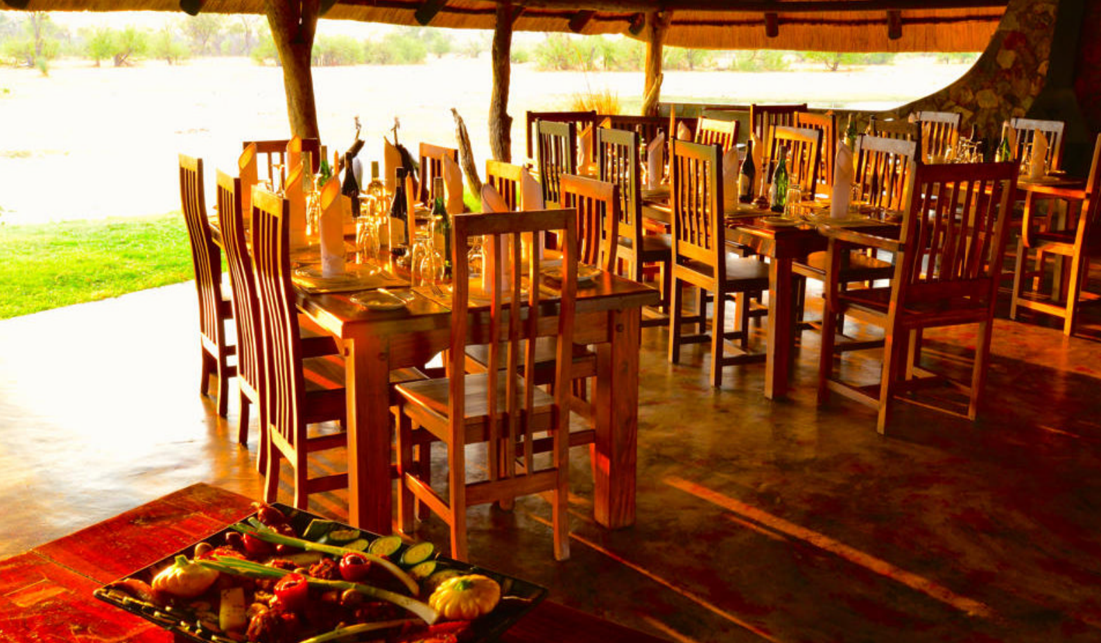
Spiseområdet i hovedbygningen, Bomani Tented Lodge.