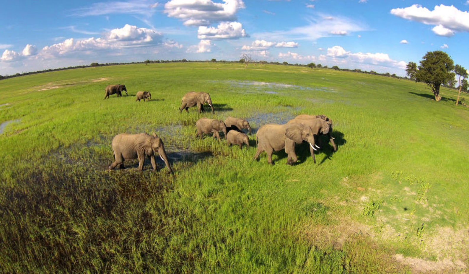
Hwange National Park er kendt for sin høje koncentration af elefanter.