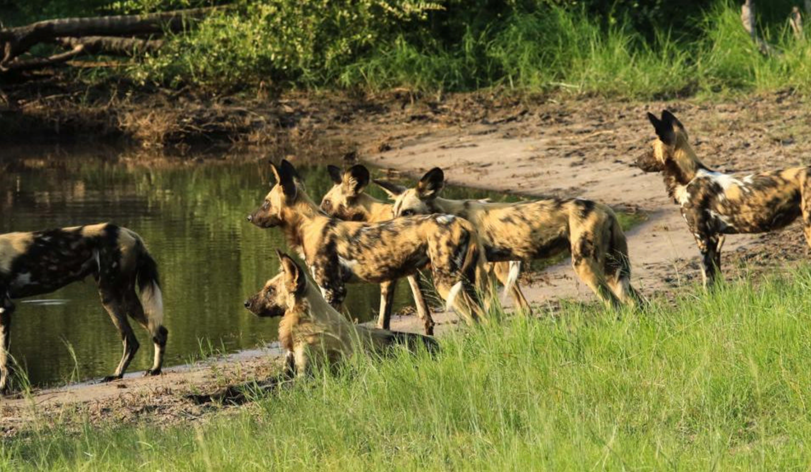
Hyæner ved vandhullet i Hwange National Park.

Bomani venter der lidt forfriskninger ved lejrbalet før jeres 3-retters middag bliver serveret.