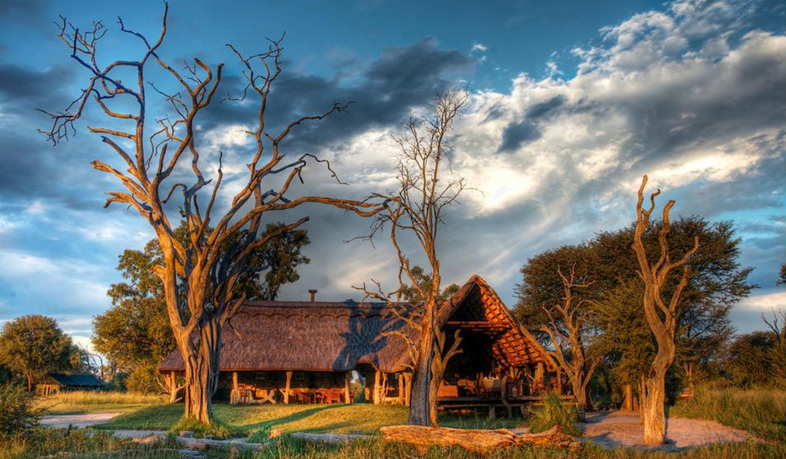
Hovedbygningen i Bomani Tented Lodge.