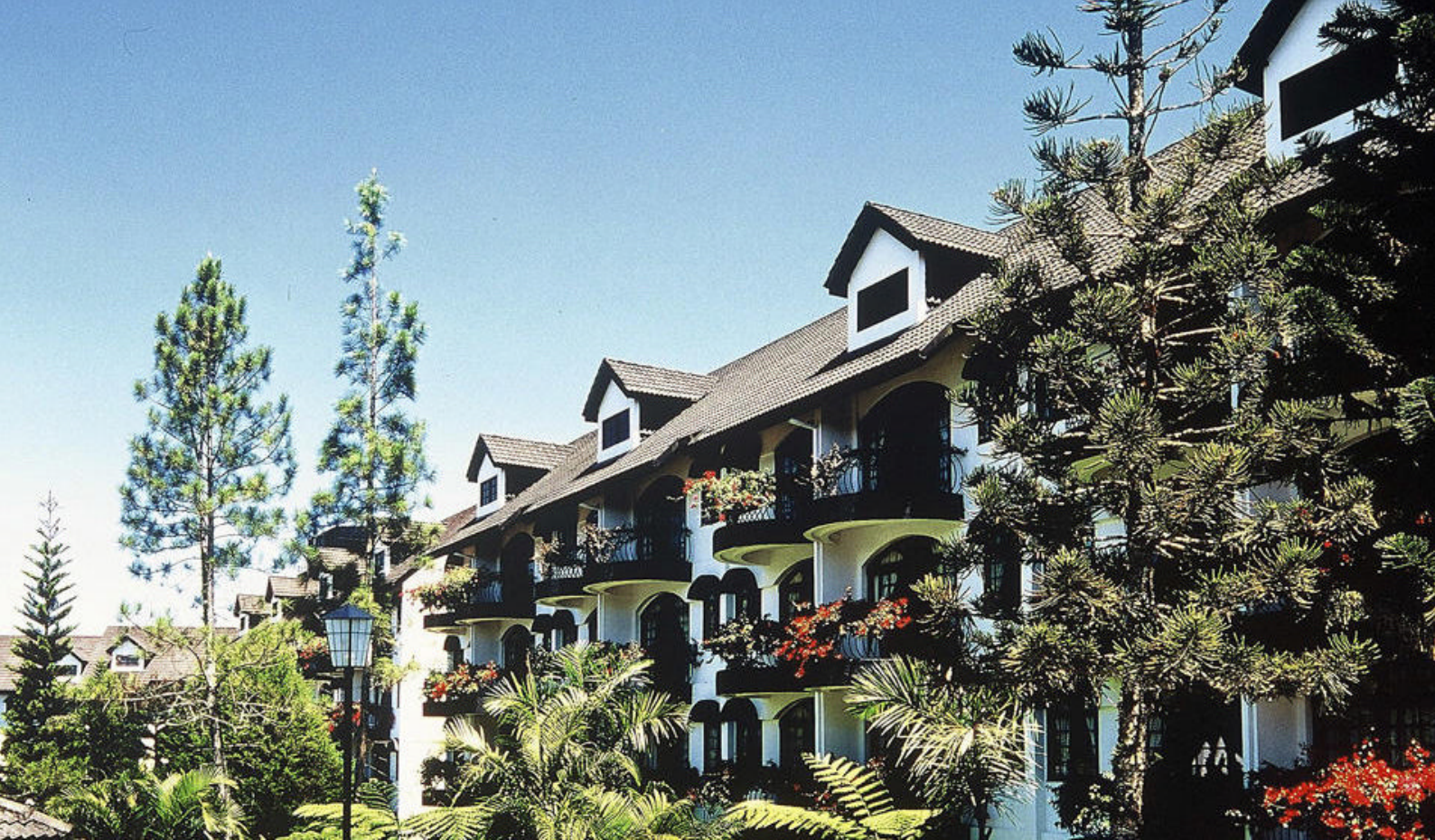
Rejser til Malaysia | Cameron Highlands | Strawberry Park

Nyd morgenmaden på jeres boutique hotel, inden det er tid til at tage ud på den første af dagens to udflugter.