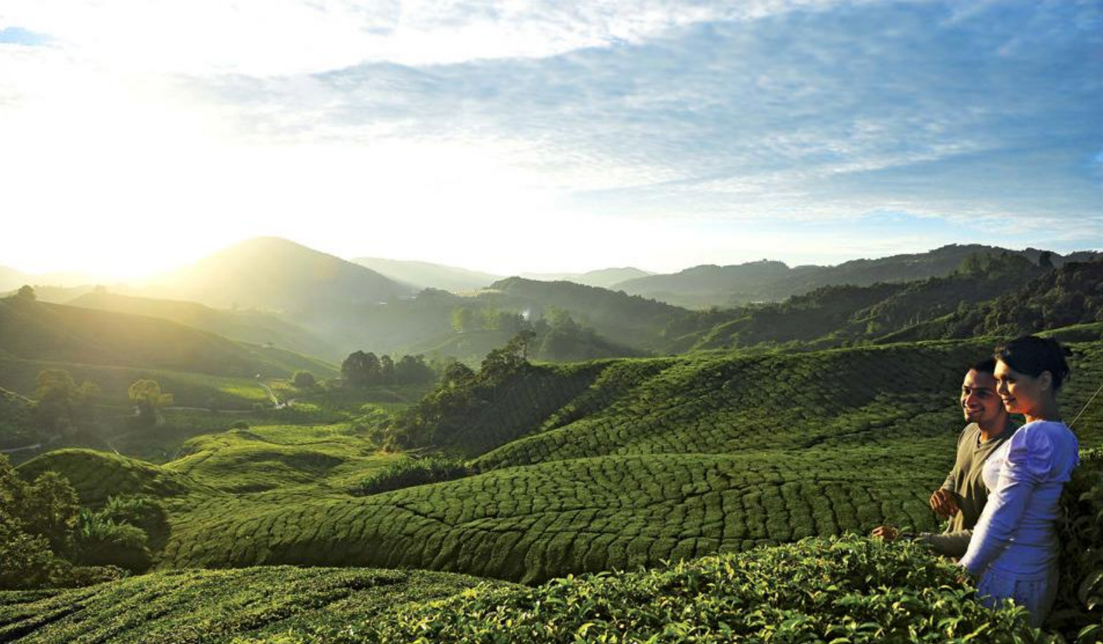
Rejser til Malaysia | Cameron Highlands | Temarker overalt

Overnatning: Strawberry Park Resort, studio room