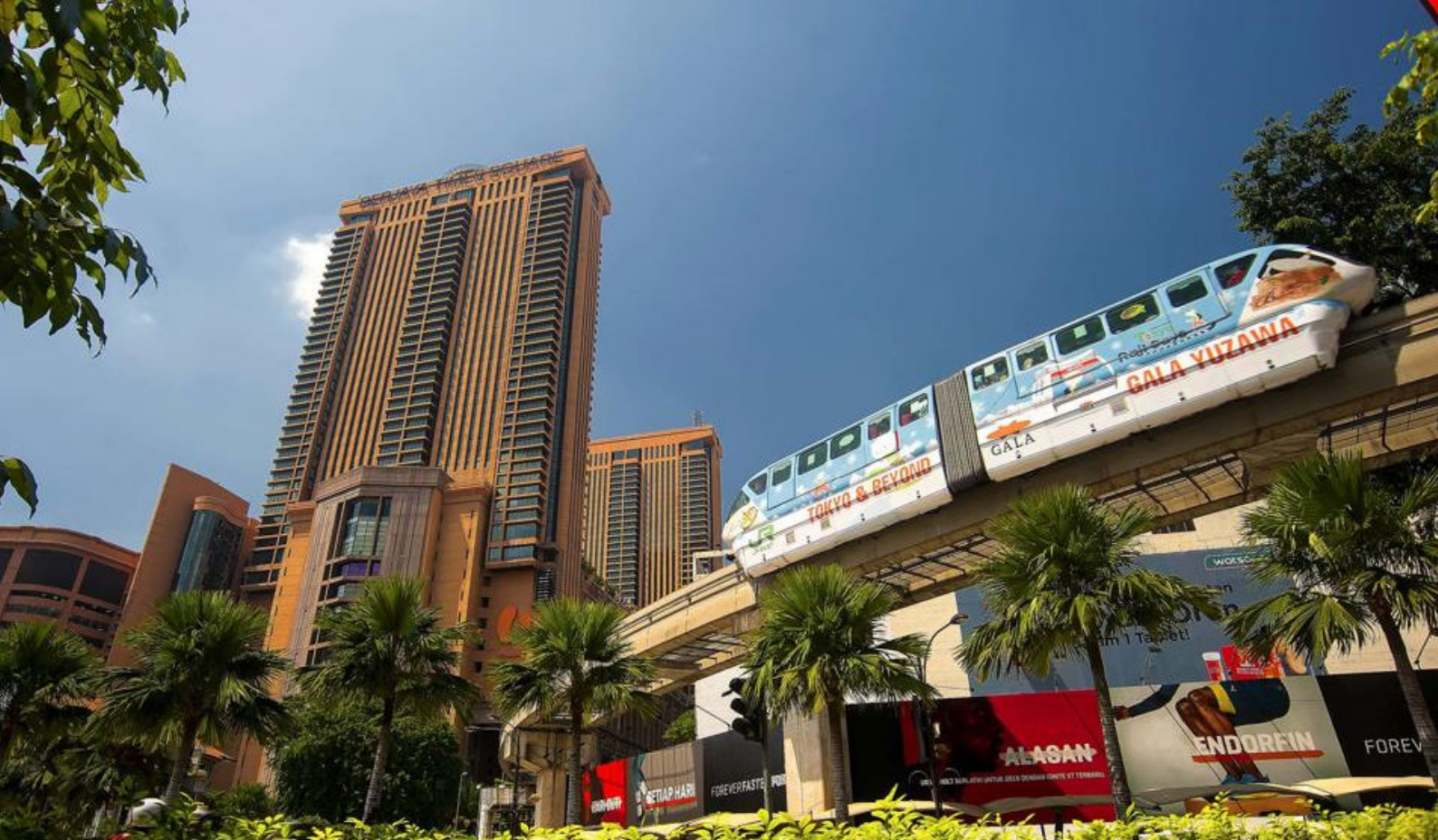
Rejser til Malaysia | Kuala Lumpur

Værelserne er ganske rummelige og indrettede i et stiligt og smart design og med alle moderne bekvemmeligheder. Et rigtig godt hotel i hjertet af Kuala Lumpur.