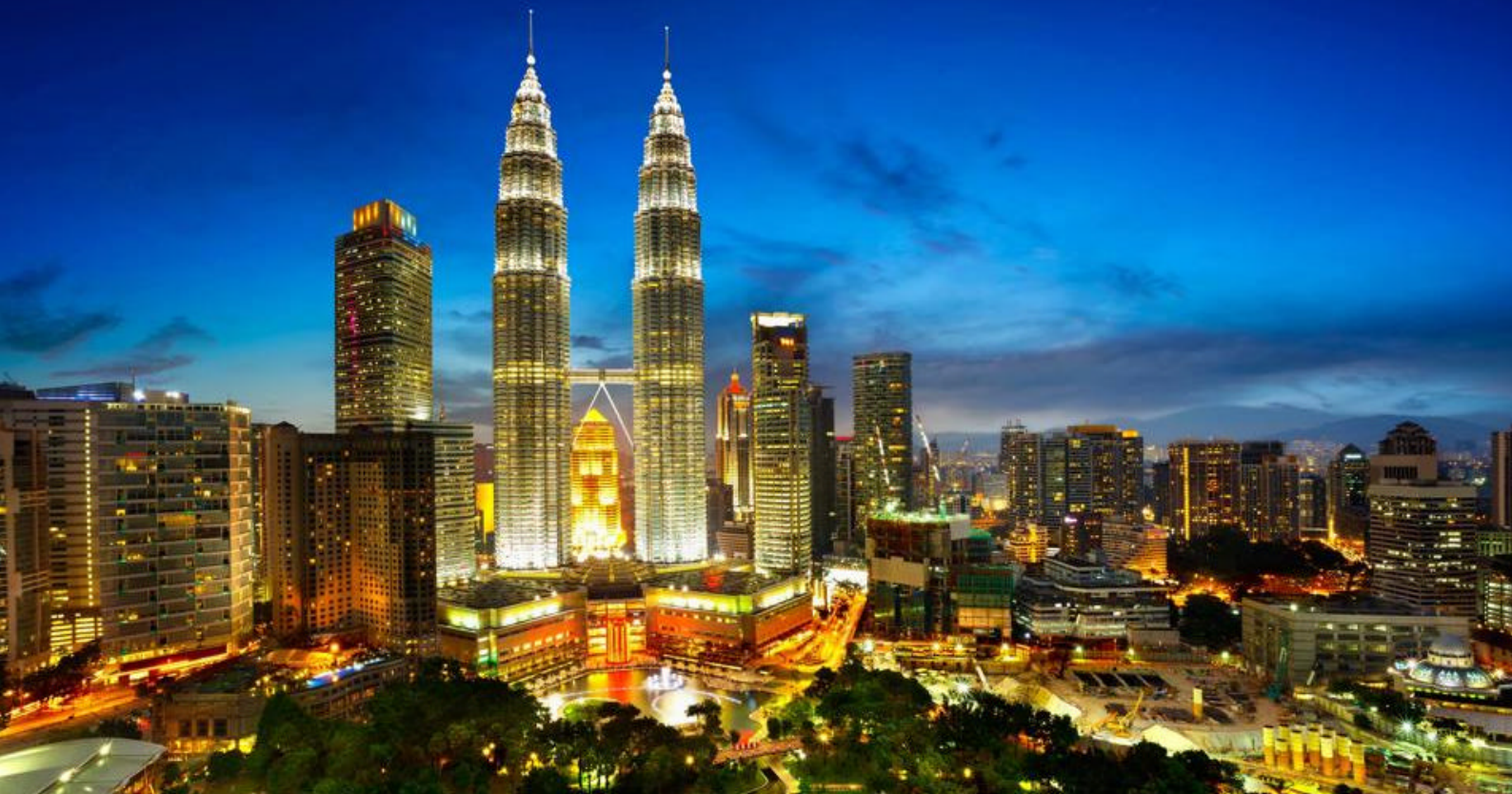
Rejser til Malaysia | Kuala Lumpur | Petrona Towers