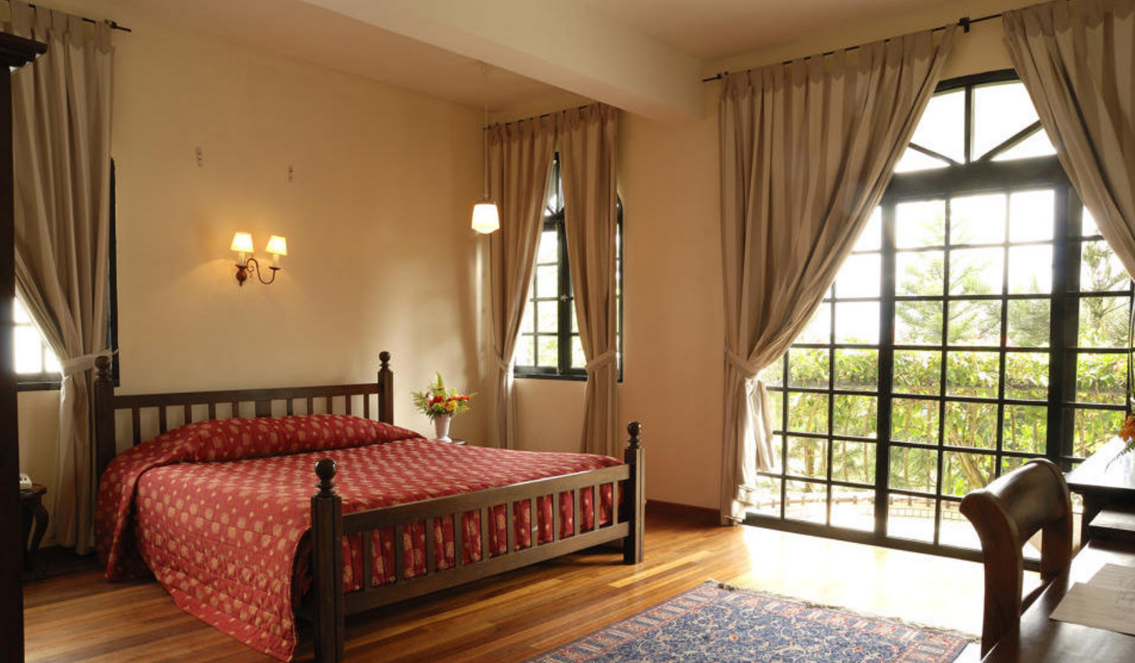
Rejser til Malaysia | Cameron Highlands | Strawberry Park, studio room