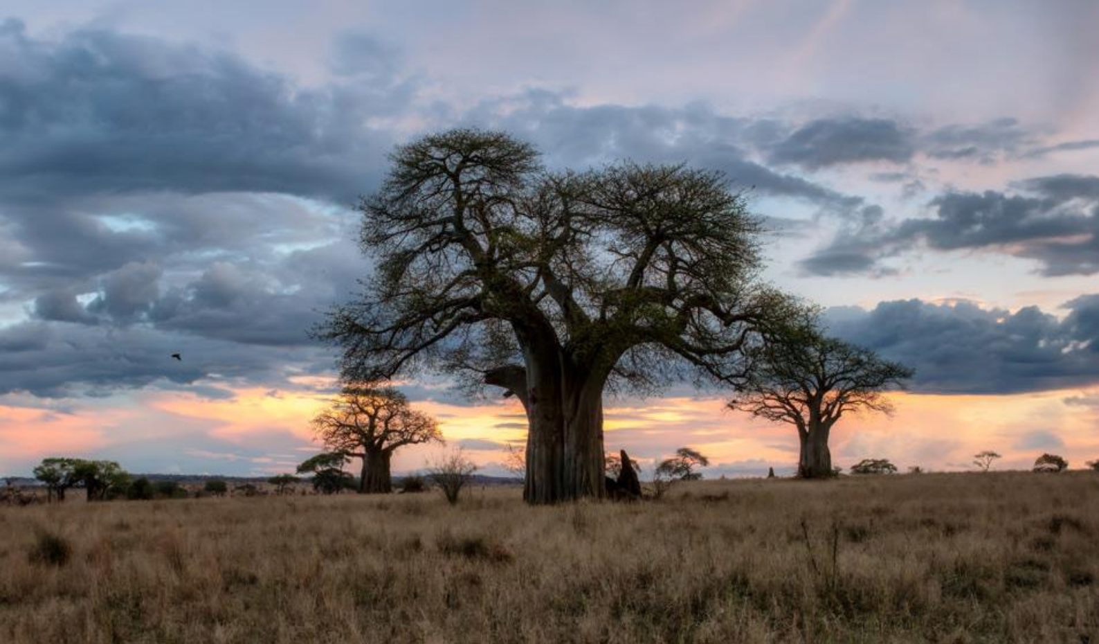
Baobab-træerne i Tarangire

Resort & Spa på øens østkyst. Resortet ligger direkte ved stranden omgivet af palmer og tropiske haver og bliver jeres base de kommende seks nætter.