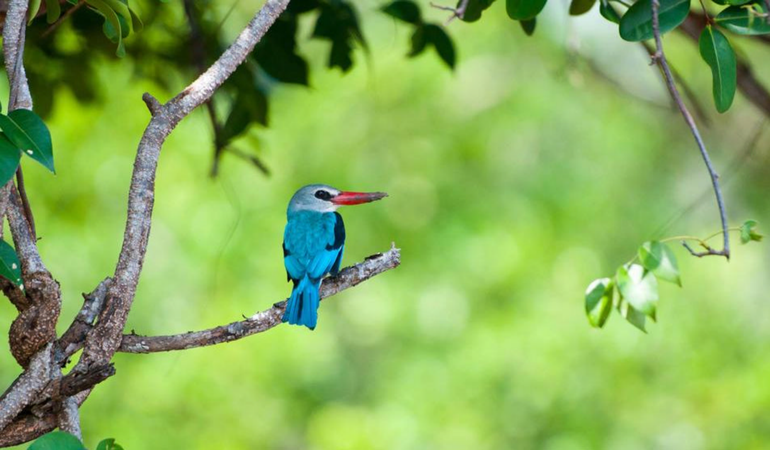
Den smukke Kingfisher fugl

Herfra flyver I mod Danmark med ankomst om morgenen d. 17. juli - fyldt med minder om safari blandt Afrikas vilde dyr og afslappende dage ved Zanzibars smukke kyst.