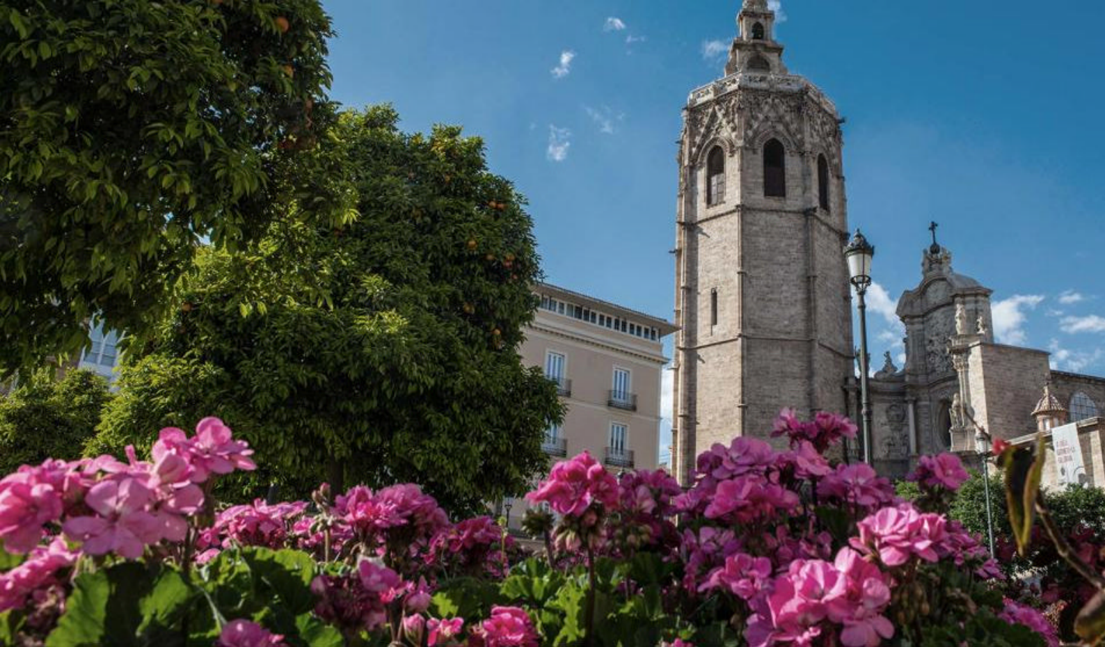
Den gamle by i Valencia, Spanien