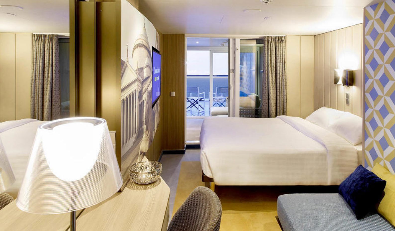
Balkonkabyt på Costa Smeralda

og inkluderer drikkepenge. Pakken skal bestilles af alle i kabytten. Børnenes drikkepakker indeholder kun alkoholfrie drikke.