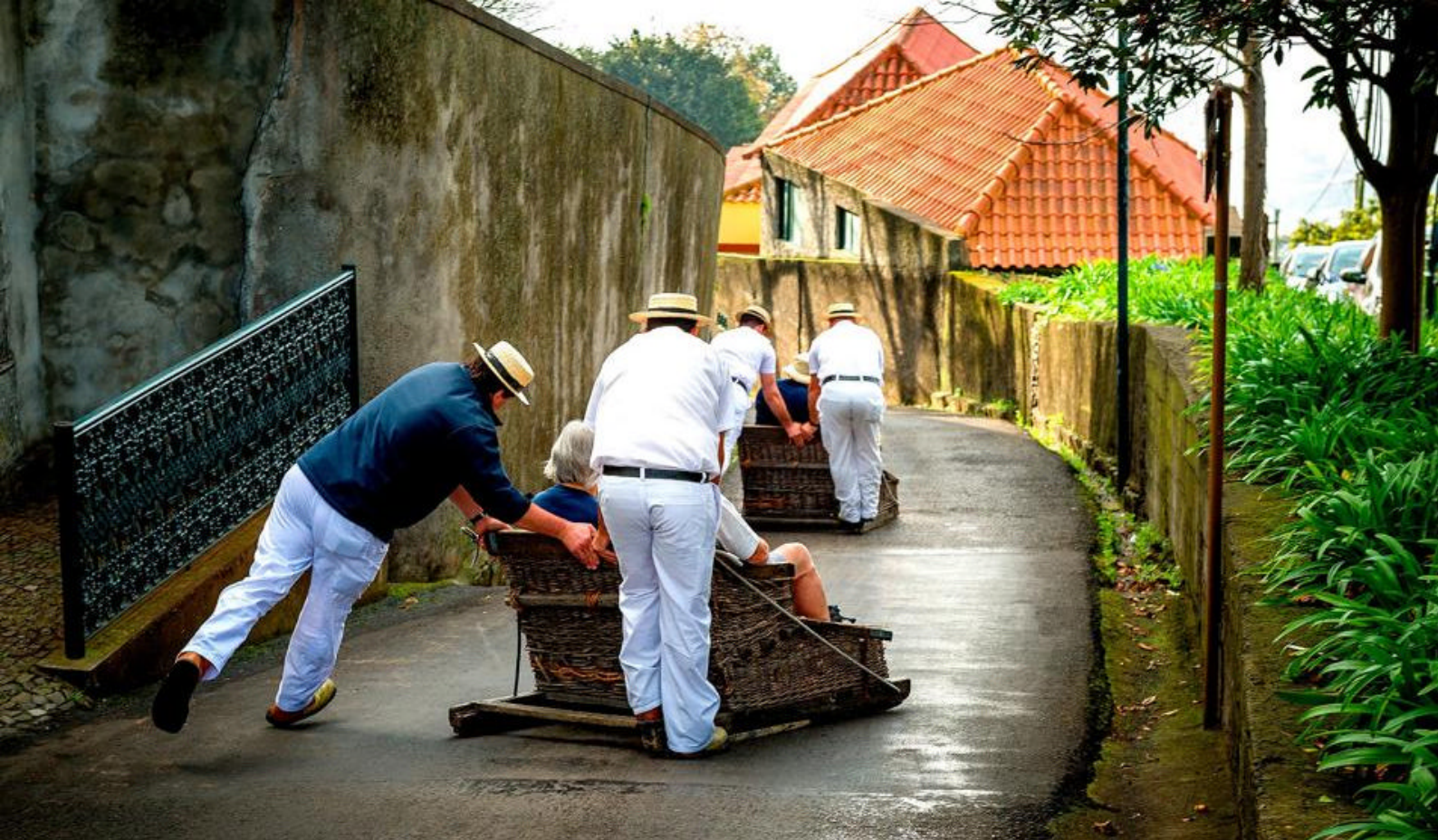
Kør ned gennem byen i de berømte Toboggan i Funchal på Madeira

Flyafgangen fra Las Palmas er kl. 14.15 med mellemlanding i Lissabon. I skifter fly, og den videre flyvning fra Lissabon er kl. 19.05. I lander i København kl. 23.55.