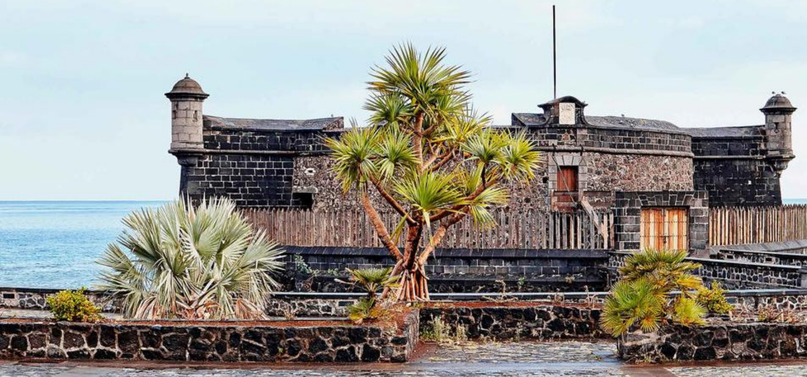
San Juan Bautista Castle er en historisk fæstning i Santa Cruz de Tenerife og har spillet en afgørende rolle i byens historie

dining-oplevelser, som tilbyder noget for alle smagsløg. Når I får lyst til en pause, kan I slappe af på det indbydende pooldek, hvor I kan nyde solen eller tage en forfriskende dukkert i poolen.