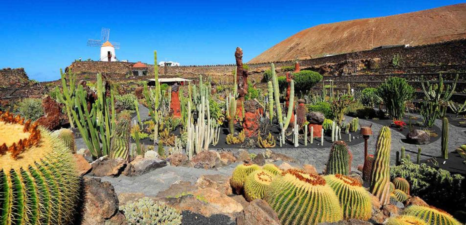
Besøg en kaktusfarm på Lanzarote

I sejler videre fra Santa Cruz den 01.02 kl. 22.00, og næste stop på jeres rejse er Arrecife på Lanzarote.