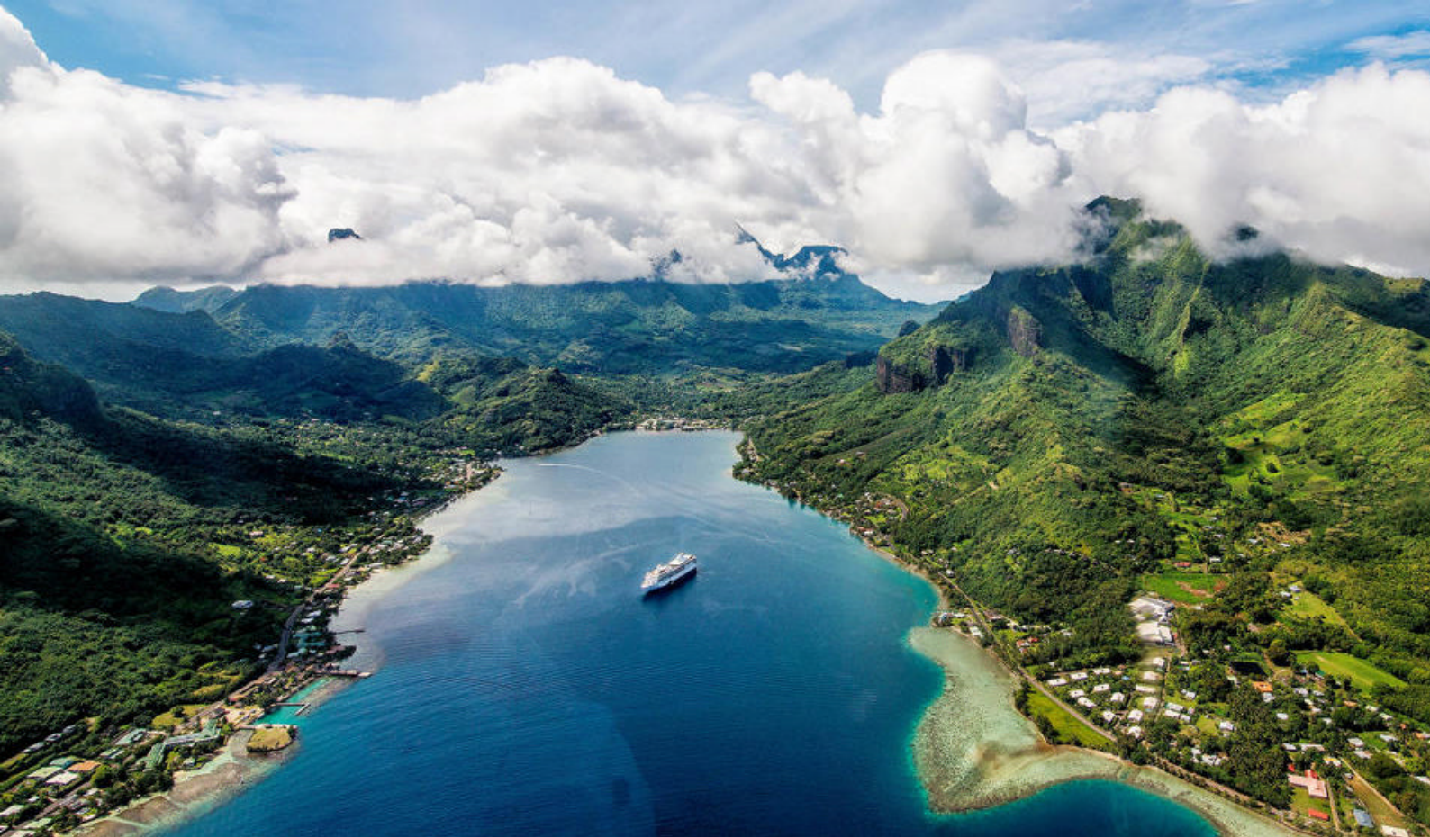
Cook's Bay i Moorea, Fransk Polynesien