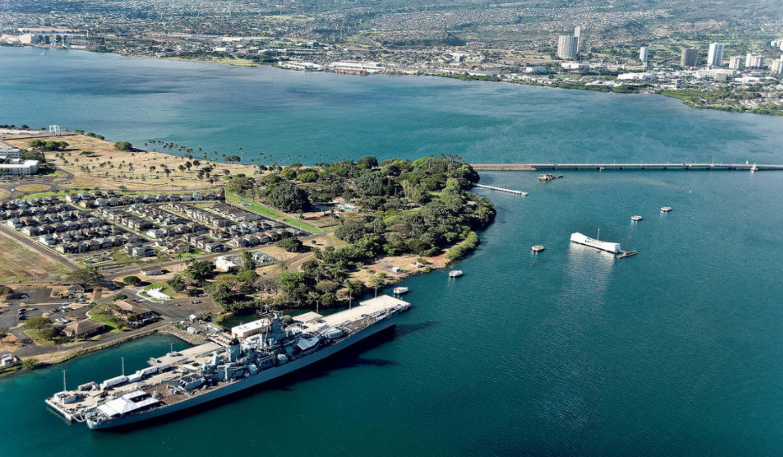
I besøger historiske Pearl Harbor på Oahu, Hawaii

Slentre gennem byens livlige markeder, hvor duften af vanilje, frisk frugt og blomster blander sig med lyden af lokal musik. Tag på udflygt til vandfald, sorte lavastrande og det frodige indre af øen, hvor stier snor sig gennem regnskov og forbi skjulte ferskvandspools. Du kan også tage en sejltur langs kysten, besøge museer eller nyde en traditionel polynesiske middag med dans og ildshows.