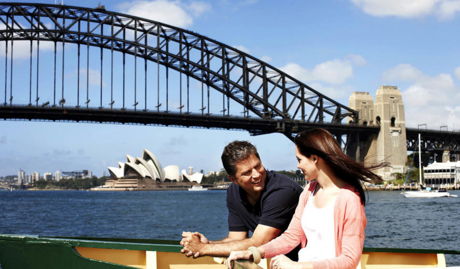
Operahuset og Harbour Bridge i Sydney, Australien

guide på Oahu og har desuden mulighed for egne eventyr, afslapning på stranden eller shopping i Honolulu.