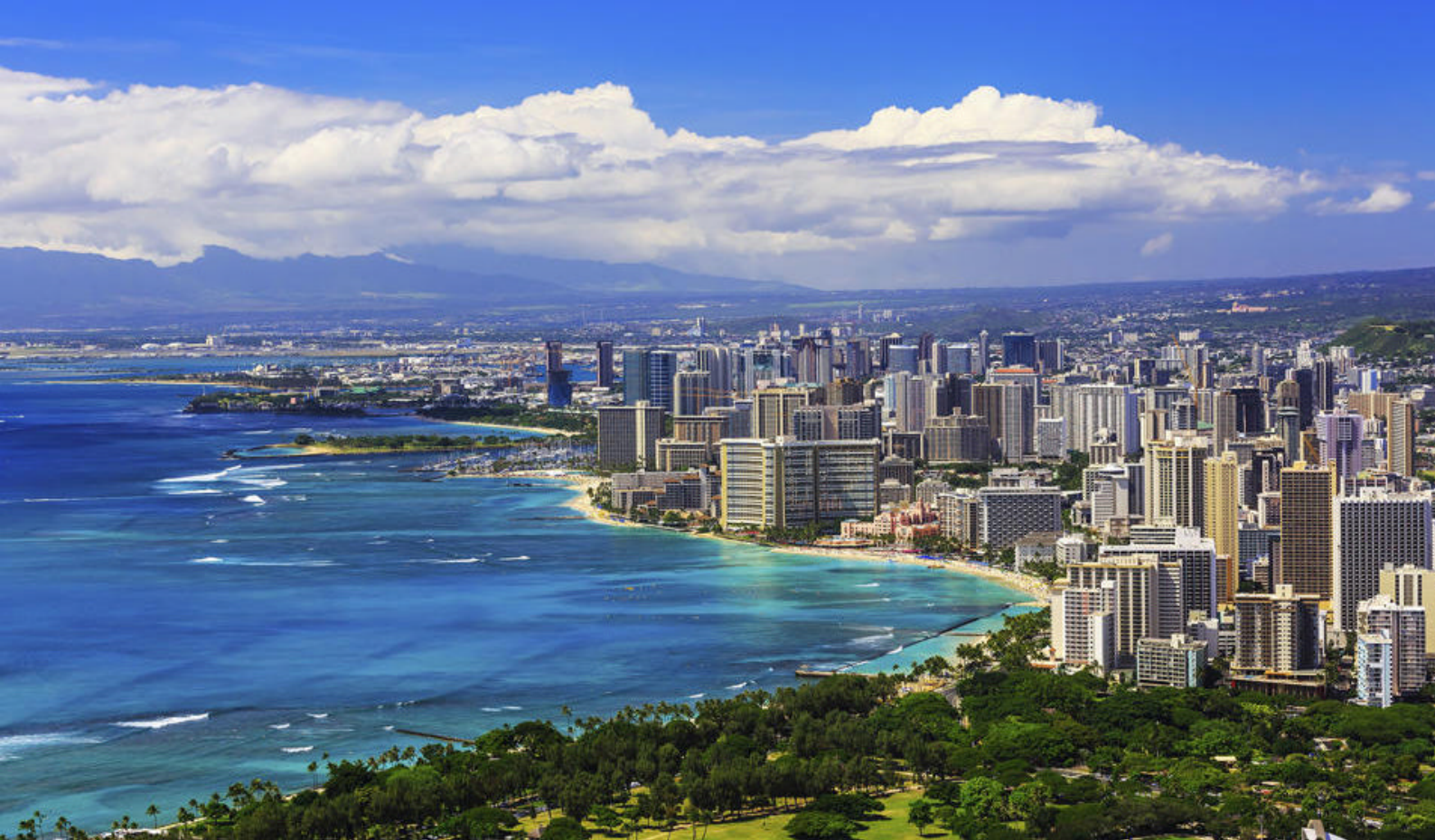
Honolulu på Oahu, Hawaii