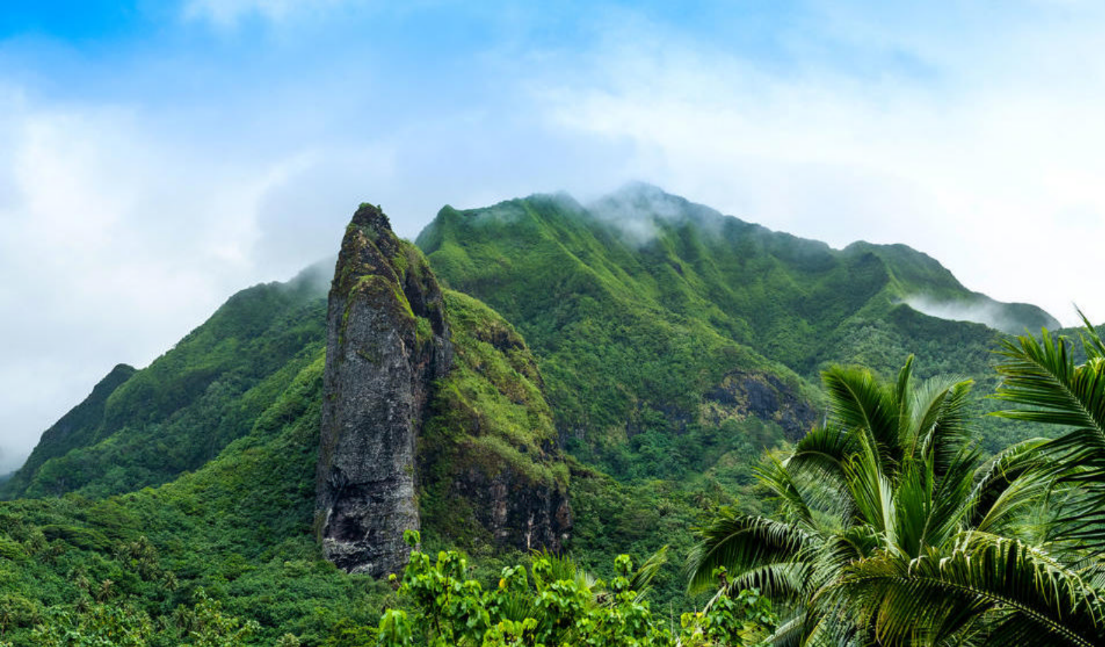
Raiatea, Fransk Polynesien