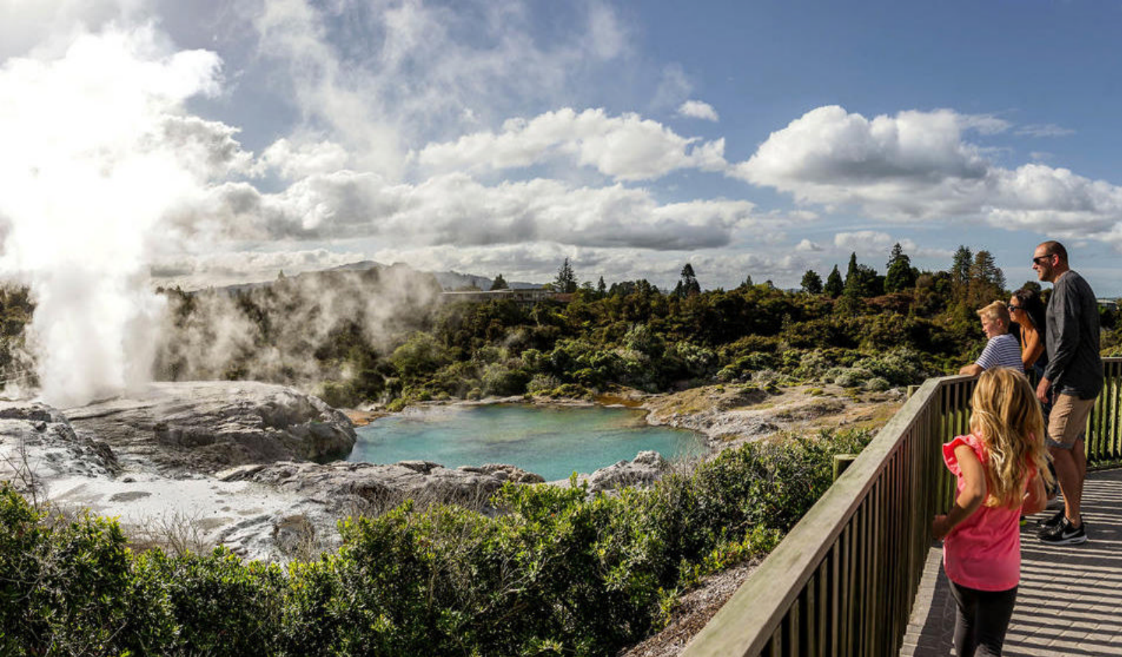
Se vulkanske landskaber og geotermisk aktivitet i Rotorua på Tauranga, New Zealand

Vi sammensætter hele pakken med transport, overnatning og oplevelser. Der er altså tænkt på alt omkring logistikken, så I skal bare læne jer tilbage og nyde det!