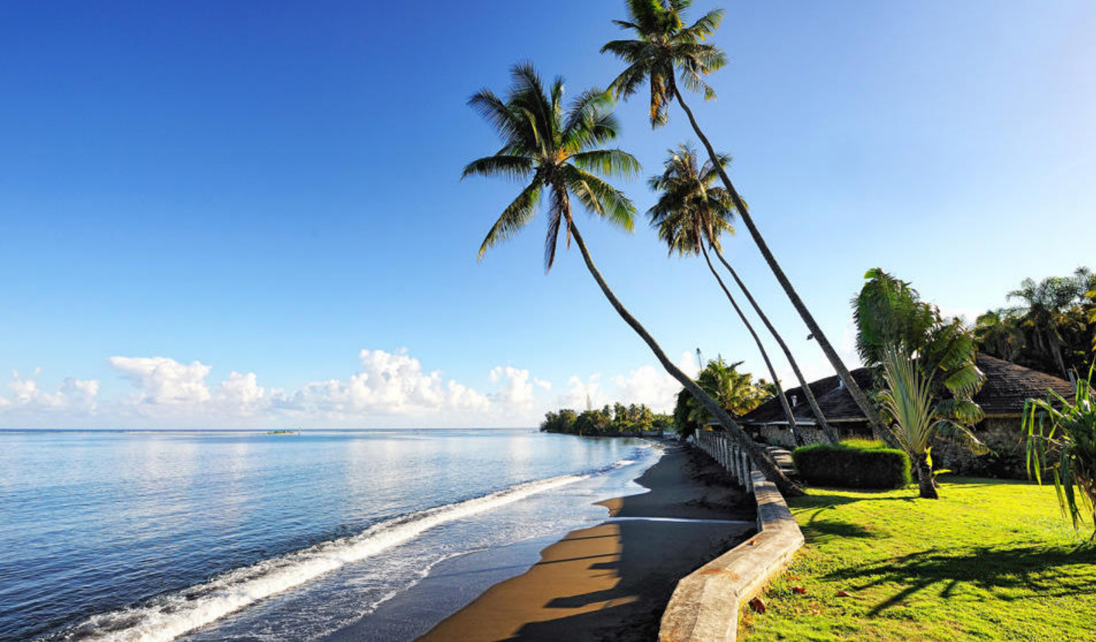
Sorte strande og svajende palmer på Tahiti