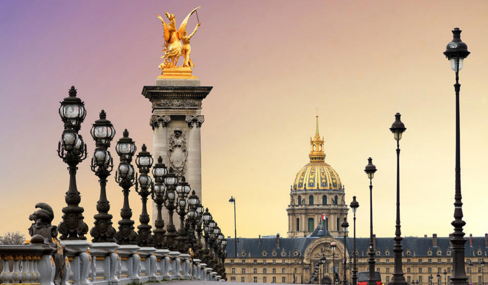
Pont Alexandre III-broen med flotte statuer, og den imponerende Les Invalides med sin gyldne kuppel i baggrunden