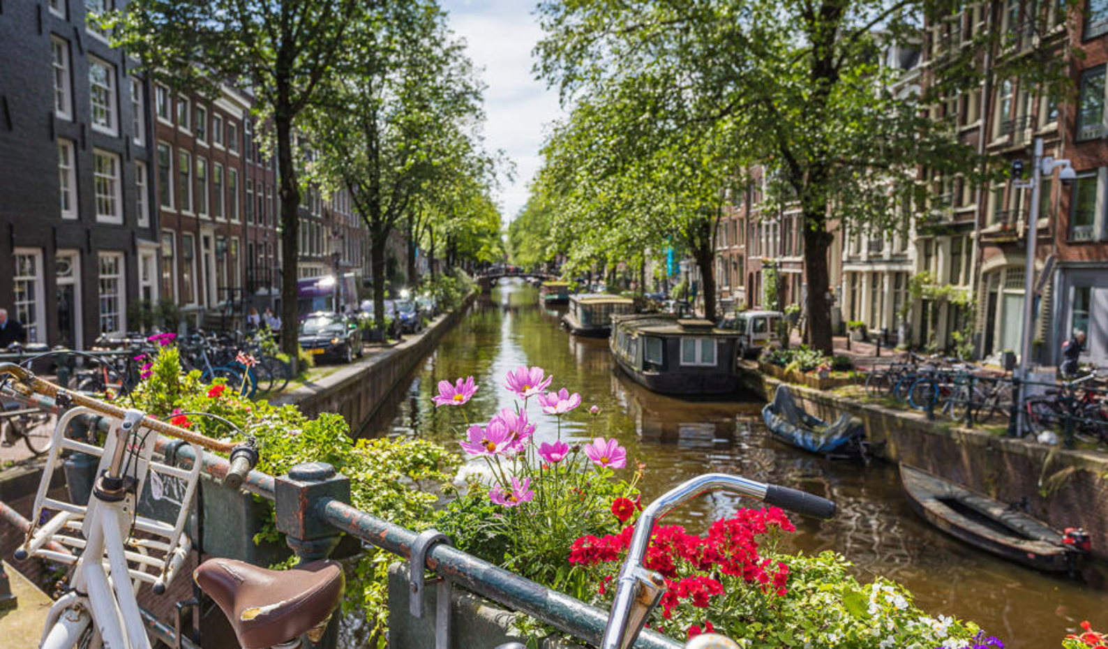
Amsterdam bør opleves fra kanalerne