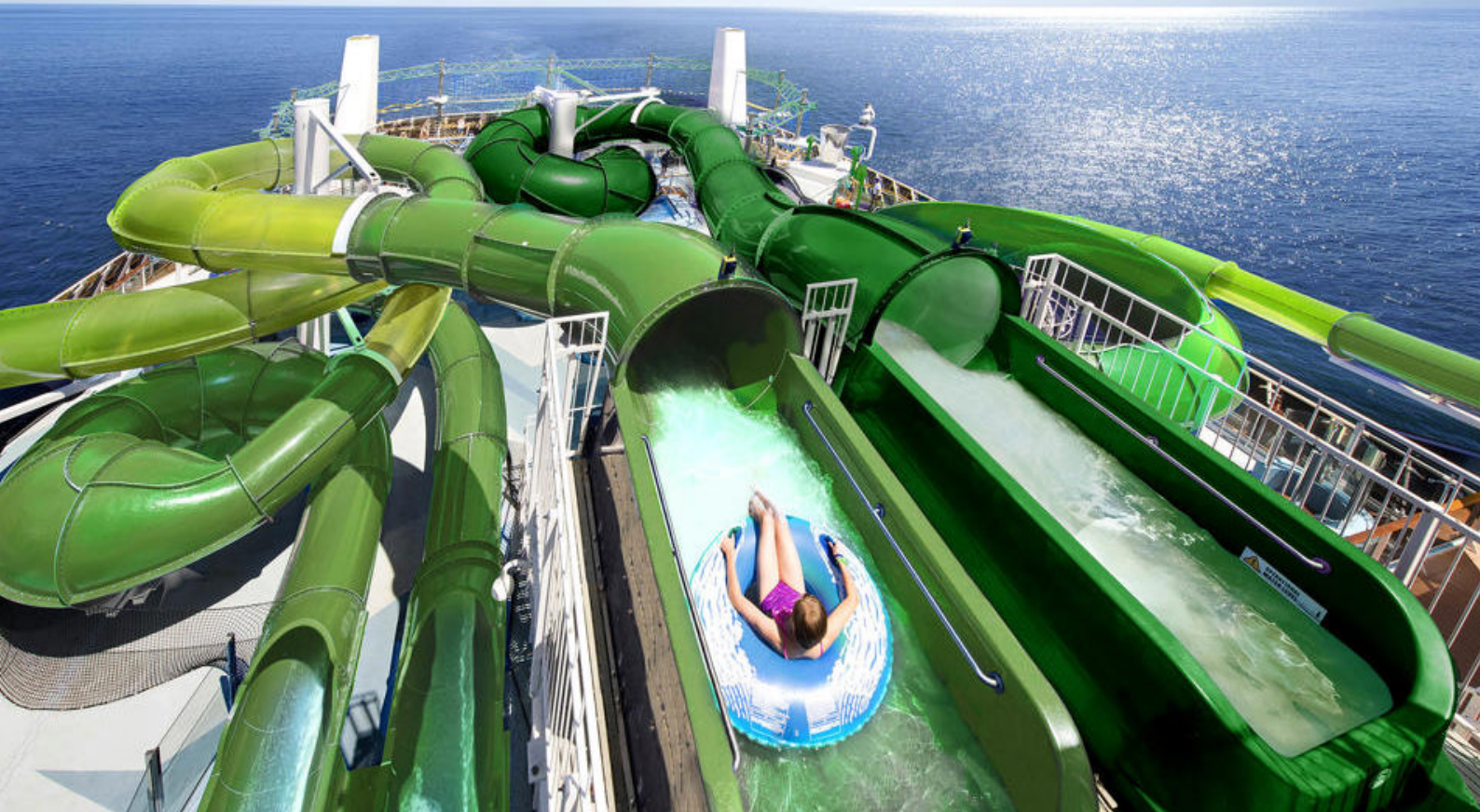
MSC Grandiosa er fuld af aktiviteter til dagene på havet

Dag 5: Ocho Rios, Jamaica - Ankomst 08.00 / Afgang 18.00 Dag 6: På havet Dag 7: Ocean Cay MSC Marine Reserve, Bahamas - Ankomst 09.00 / Afgang 18.00 Dag 8: Port Canaveral (Orlando), USA - Ankomst 07.00