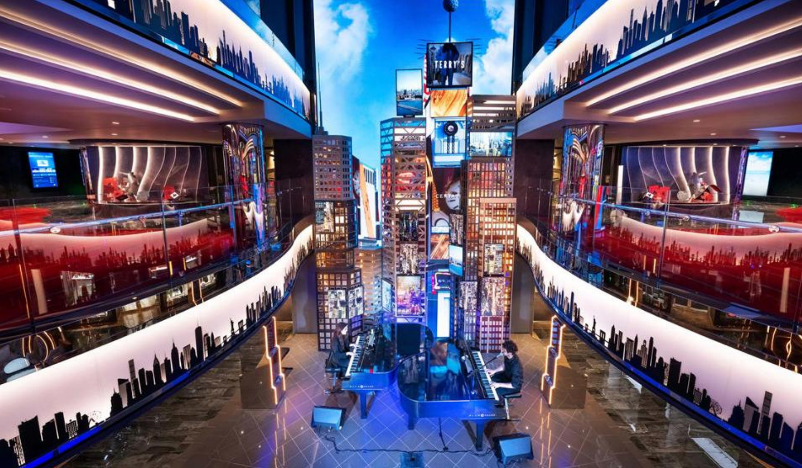
MSC Seashore har en Times Square-inspireret plads i skibets midte

som deler kahyt/ønsker at spise ved samme bord, herunder mindreårige (3-17 år). Pakken er ikke obligatorisk for børn under 3 år.