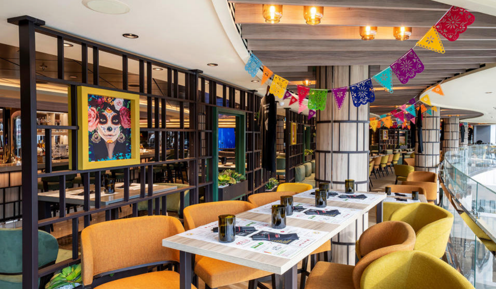
Der er masser af restauranter at vælge imellem ombord, her fra Hola! Tacos & Cantina på MSC Seashore

Dag 3: Cozumel, Mexico - Ankomst 08.00 / Afgang 17.00