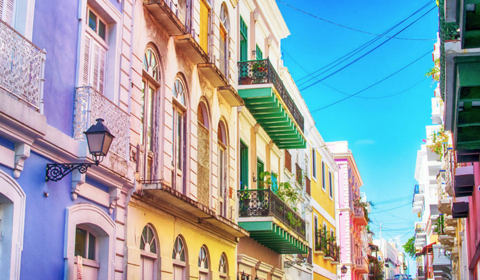
Gå på opdagelse i Old San Juan, Puerto Rico

Ankomst 08.00 / Afgang 20.00 Dag 8: Miami, USA - Ankomst 07.00