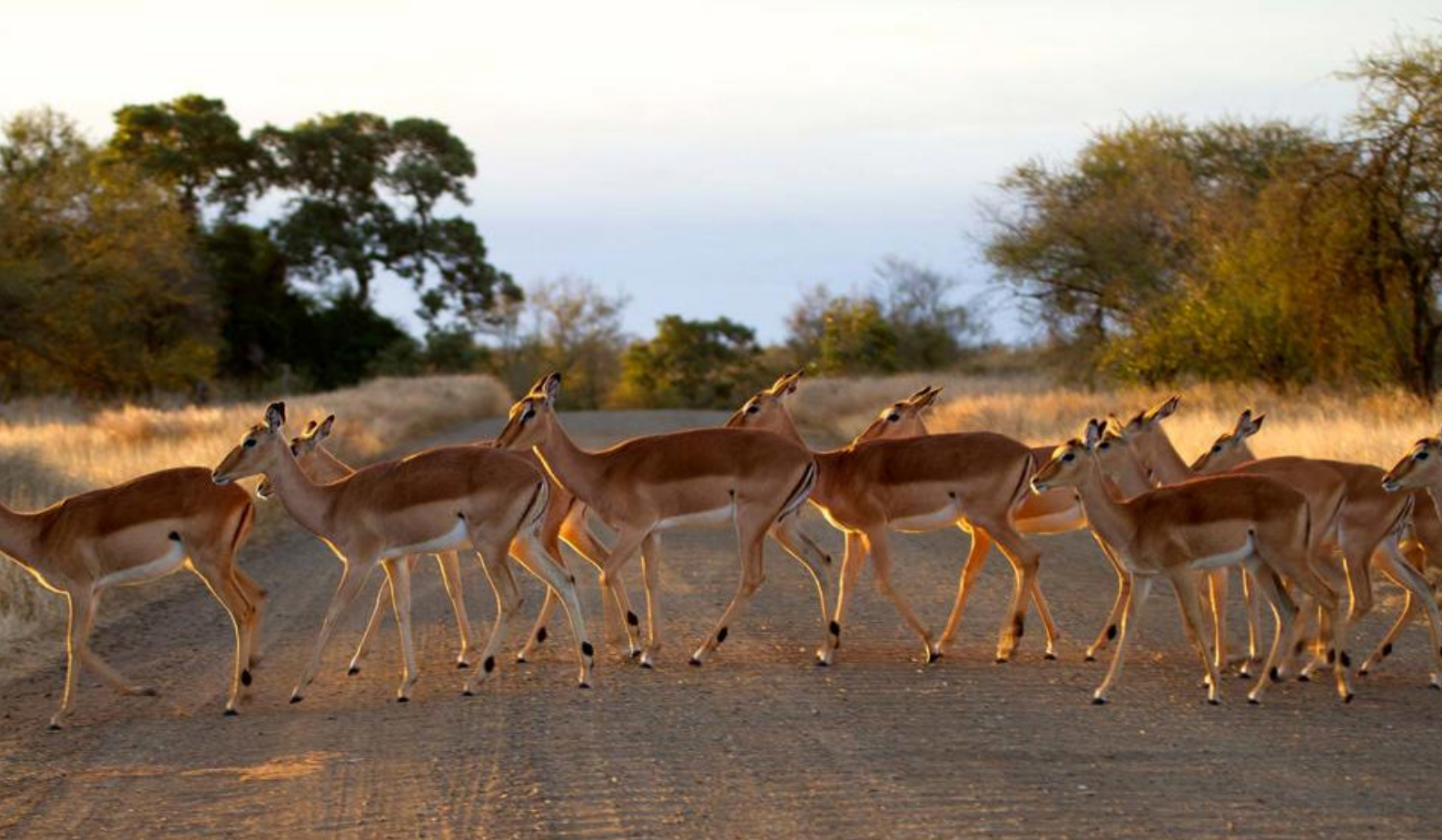
Impalaer i Krüger