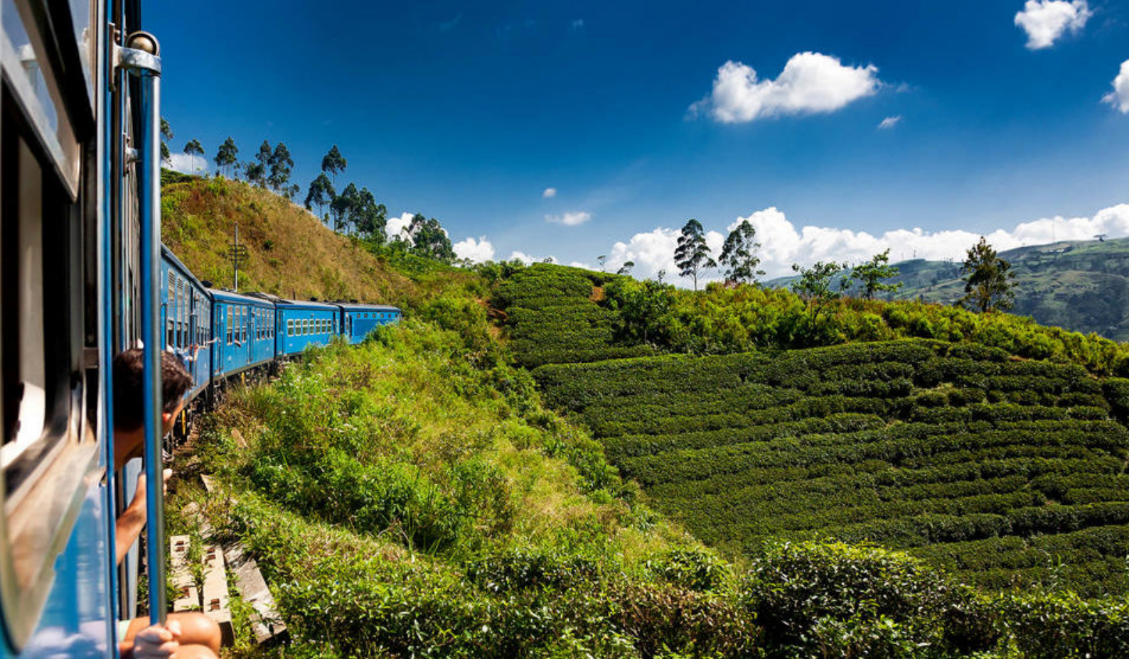
Se de frodige landskaber på den sceniske togrejse fra Nuwara Eliya til Ella

mangfoldige naturreservater. Parken tilbyder en utrolig rigdom af flora og fauna og er kendt for sin store bestand af vilde dyr, herunder elefanter, leoparder, vandbøfler, hjorte og et bredt udvalg af fuglearter. Leoparderne i Yala er især berømte og betragtes som nogle af de mest betroede i verden, hvilket gør det til et af de bedste steder i verden for leopard-safari.