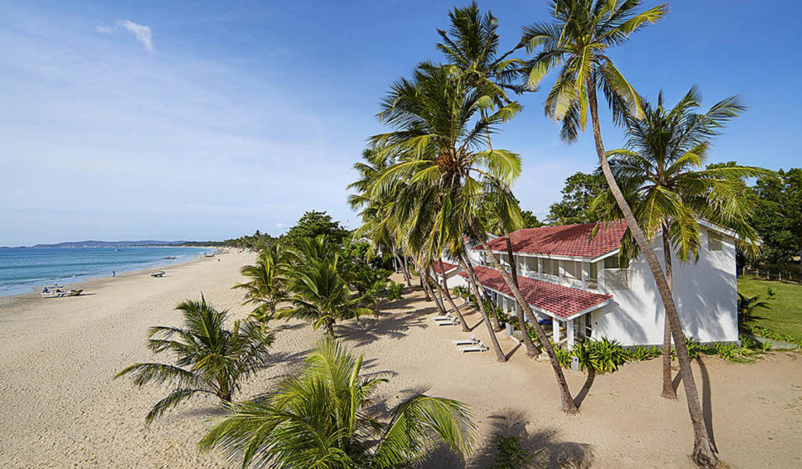
Bo direkte på stranden på resorts som Trinco Blu i Trincomalee

Batticaloa er også kendt for sine religiøse steder, herunder Kallady Mosque og St. Mary's Cathedral, der begge er vigtige for de lokale samfund og tiltrækker besøgende fra hele landet med deres arkitektoniske skønhed og åndelige betydning.