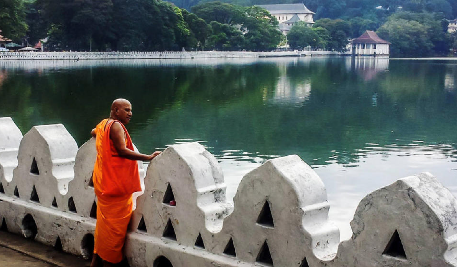
Besøg det hellige "Temple of the Tooth" i Kandy

interessante økosystemer og et dyreliv, der inkluderer elefantflokkene, fire slags hjortearter og den sjældne grønne due. Safarituren tager samlet tre-fire timer.