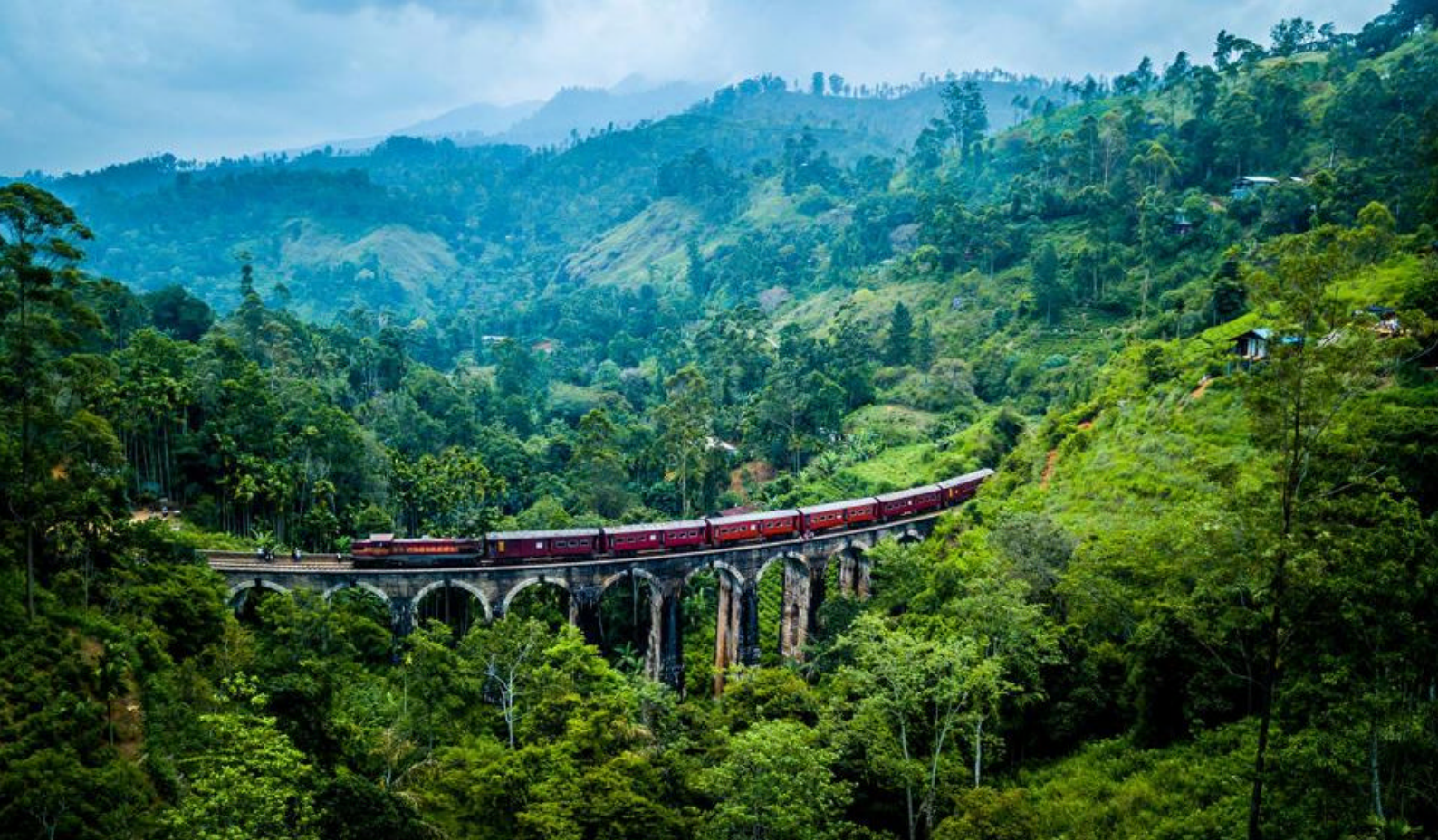
Togrejsen tager dig over ikoniske Nine Arches Bridge