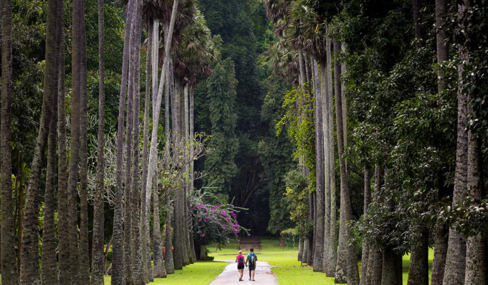
Tag på vandretur i smukke Royal Botanic Gardens i Peradeniya

planter, der afspejler landets rige krydderihandelshistorie.