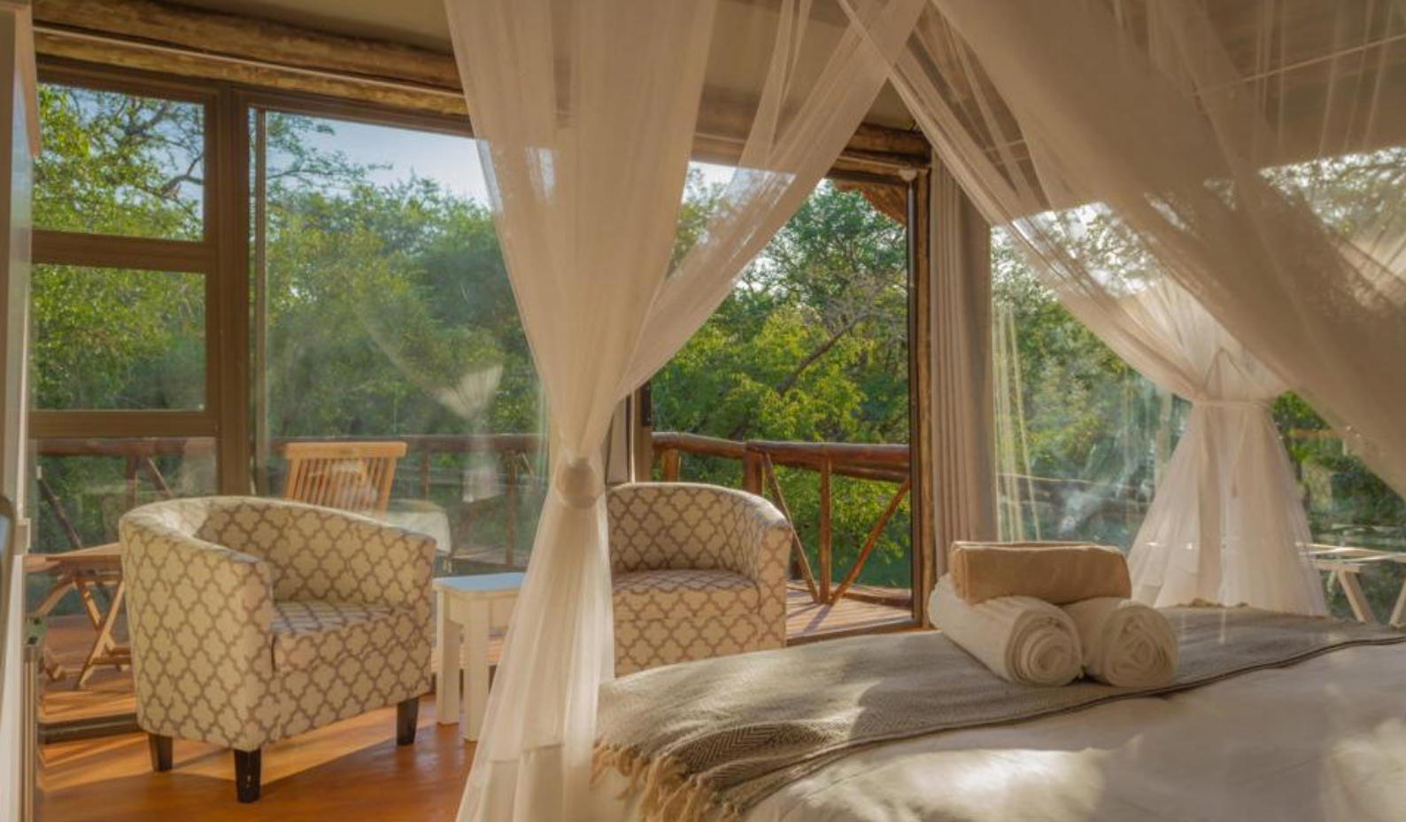
Smukke hytter i trætoppene på Panzi Lodge i Greater Kruger, Sydafrika.