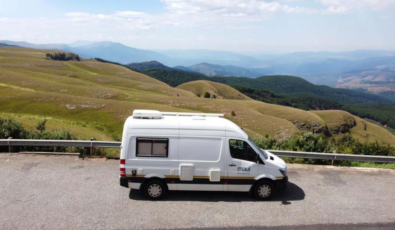
MAUI campervan i de grønne bakkede landskaber i Sydafrika

Mlondozi picnic site. Nkumbe View Site. Tshokwane trading post og picnic site på H1-2. Lille butik.