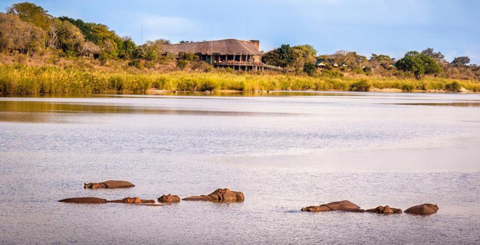
Flodheste i floden ved Lower Sabie Rest Camp