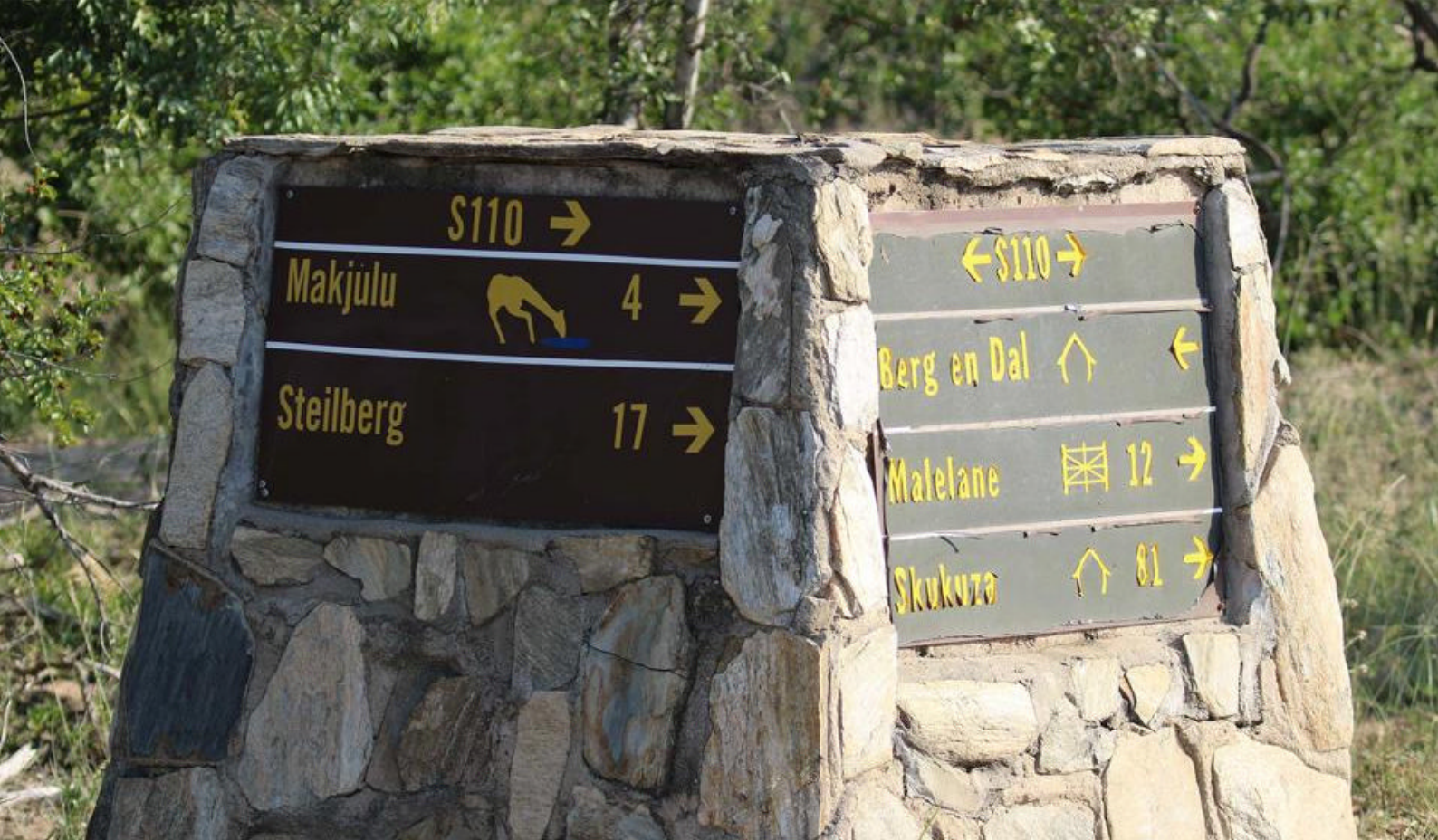
Vejskilt der viser afstandene mellem de forskellige "rest camps" i Kruger