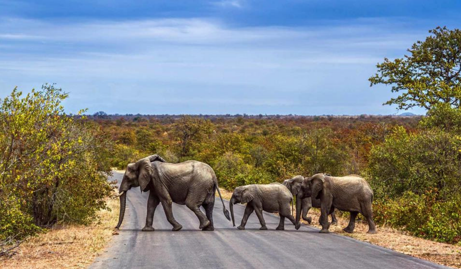
Bush elefanter på vej over asfaltvej i Kruger National Park