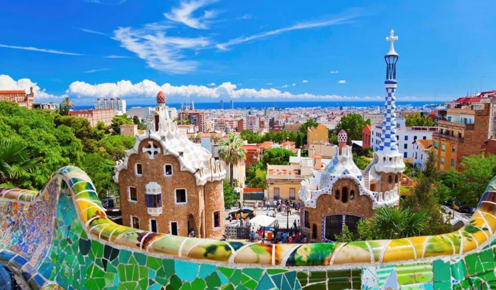
Parc Guell Mosaic, Barcelona