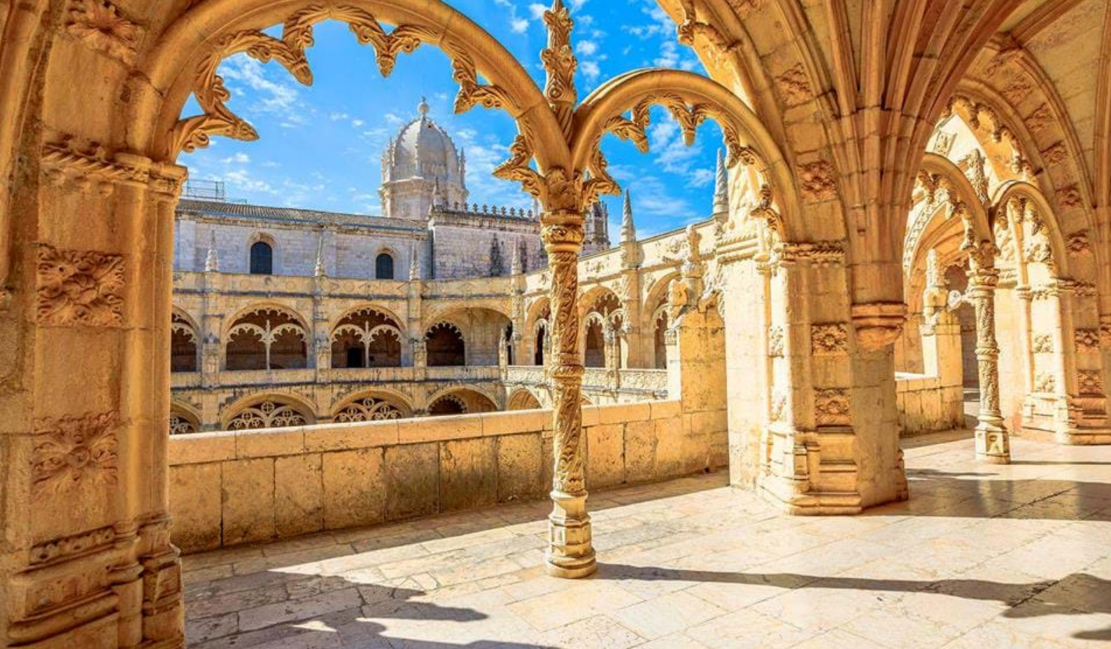
Jeronimus klosteret i Lissabon

kænguruer, kameler, ulve, elge og mange mange flere. Udover dyreparken findes bl.a. et badeområde med udendørs bølgebad, fritidspark, bilbane, bob-bane m.m., Kardemomme by, stort legeland med bl.a Norges længste rutsjebane og stor underholdningspark med mange fantastiske oplevelser.