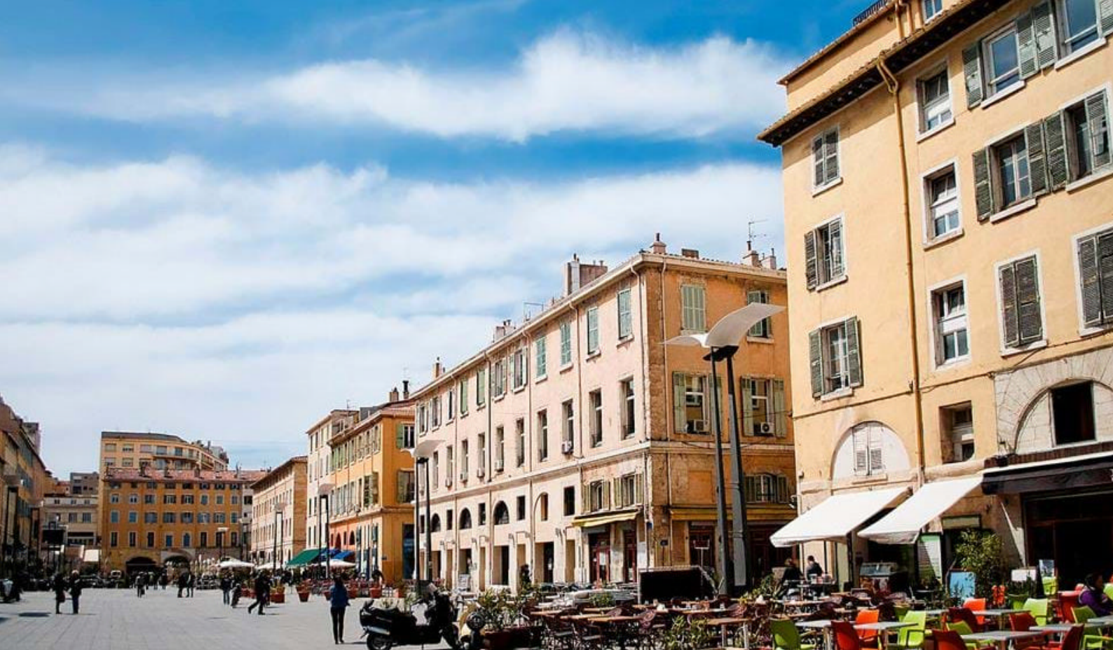
Marseilles gamle bydel