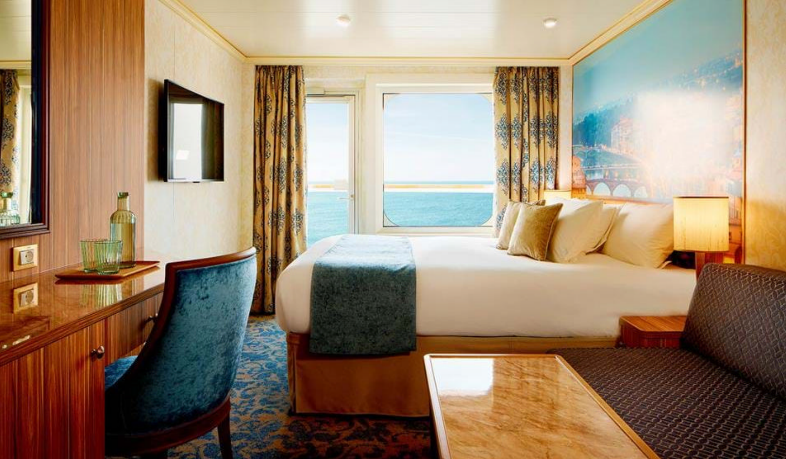
Flotte kahytter på Costa Firenze