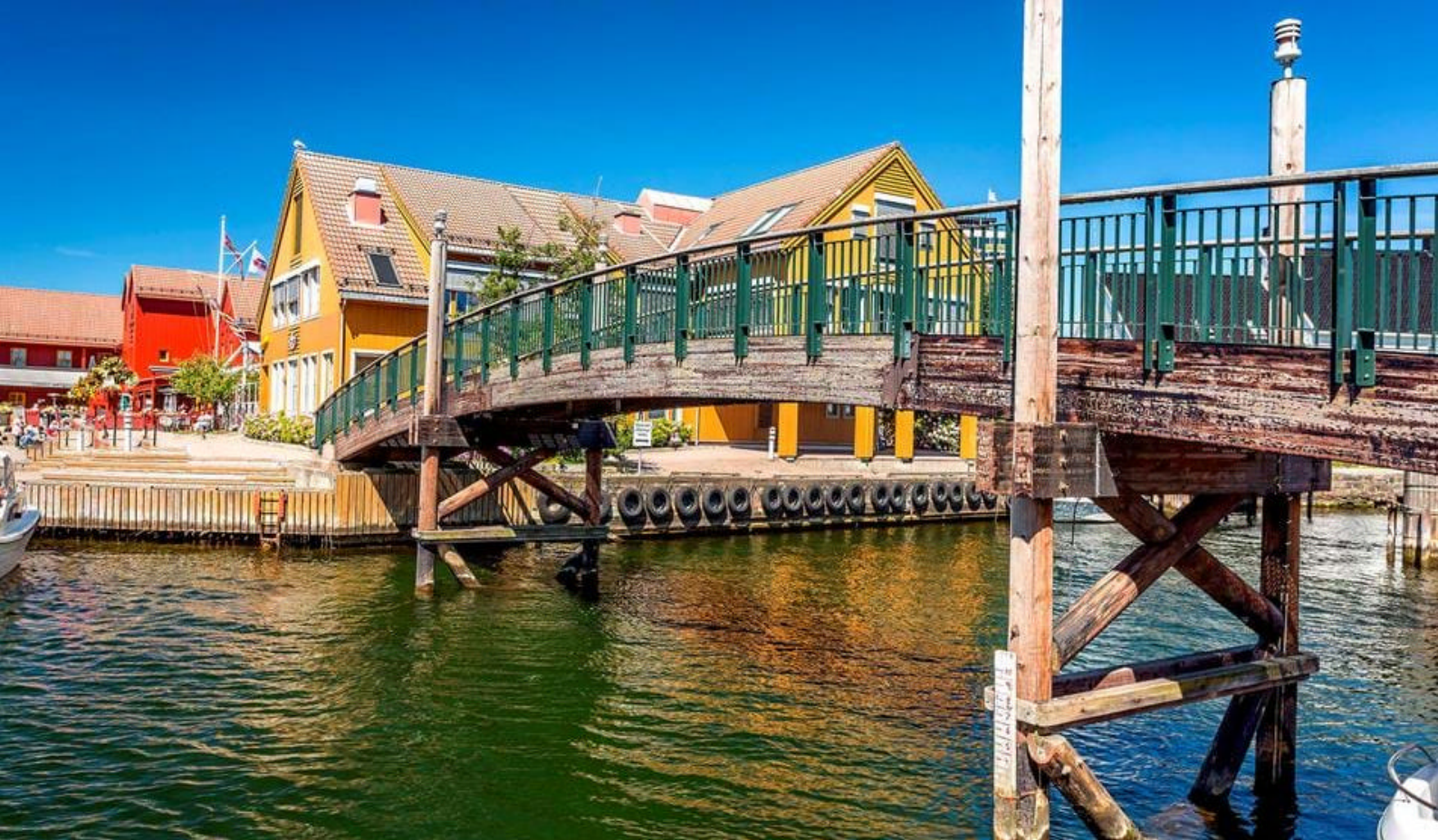
Hyggelige Kristiansand i Norge

udflugt væk fra Le Havre den dag, I er her, for i oplandet ligger der en række utrolige attraktioner, f.eks: