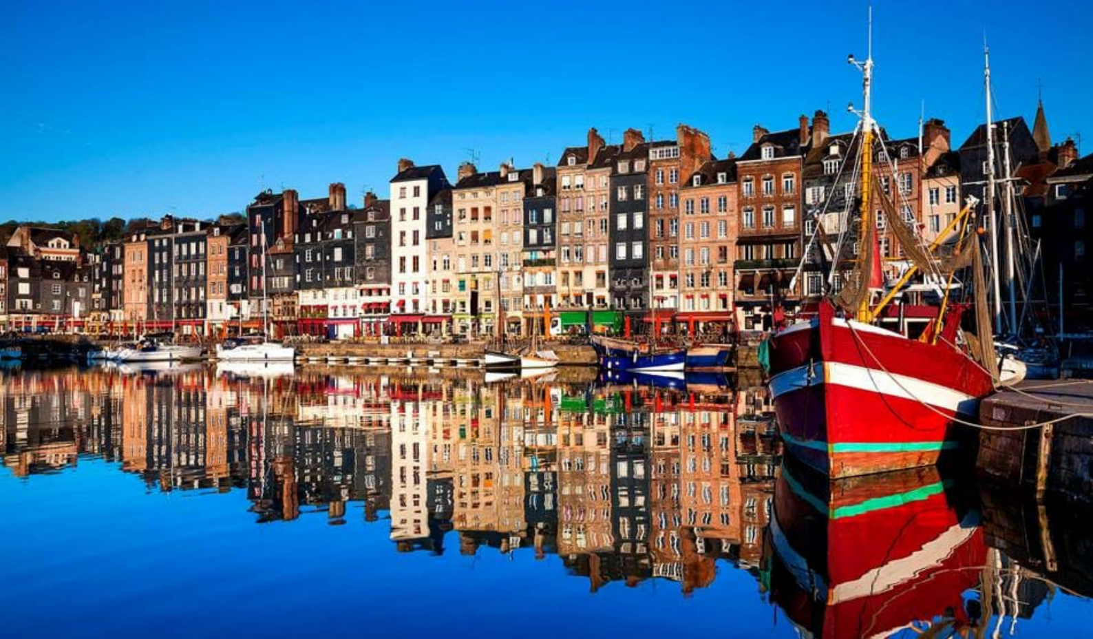
Honfleur nær Le Havre