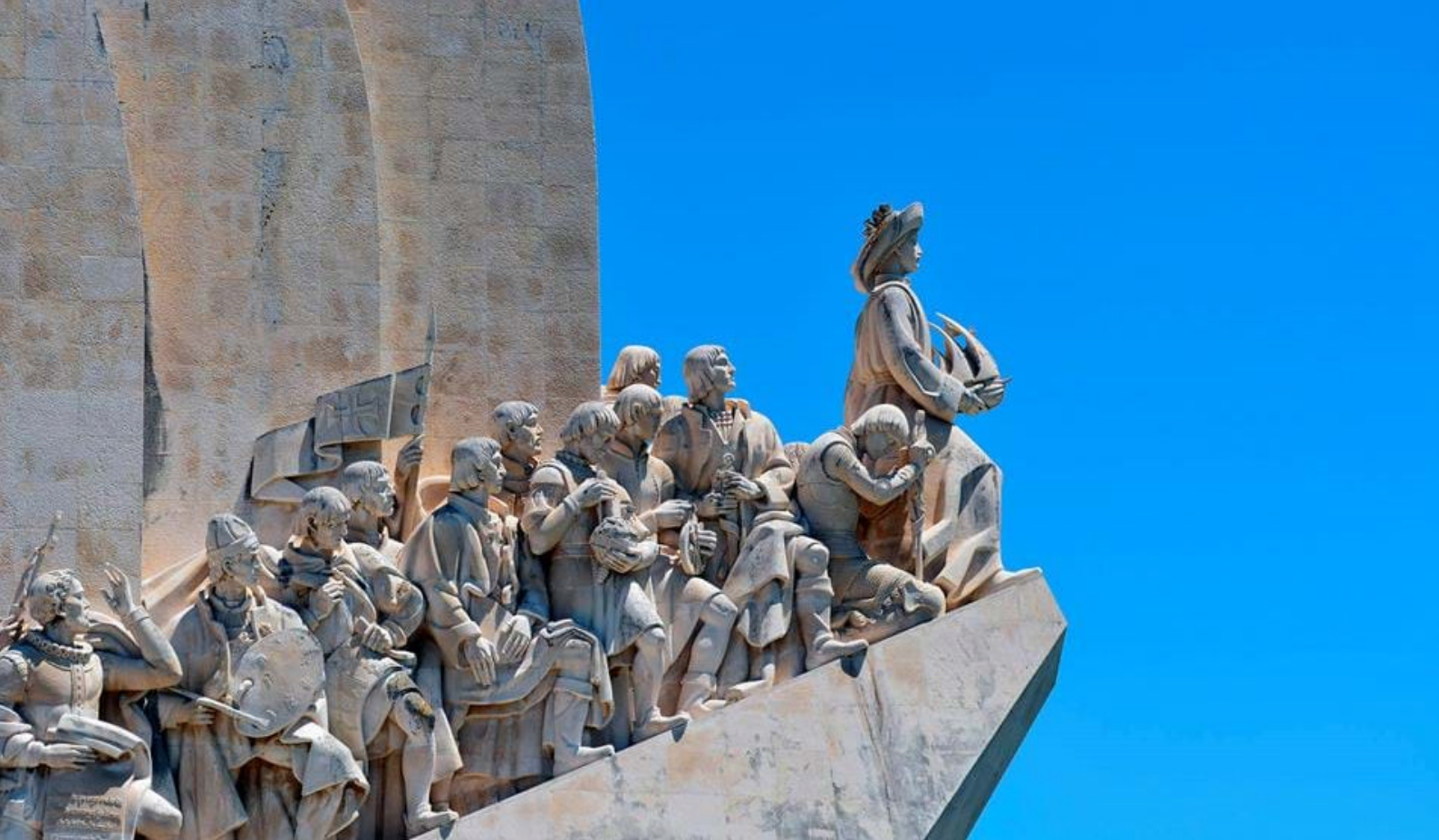
Henry Seafarer monumentet i Lissabon

enorme elevator Elevador de Santa Justa, der ligger i Baixa ved foden af Bairro Alto.